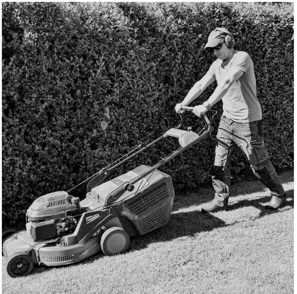
Das Rasenmähen ist nur an Werktagen gestattet. Die Ruhezeiten zu Mittag und während der Nachtstunden müssen laut Lärmschutzverordnung eingehalten werden.

Auch die Benützung von Rundfunk- und Fernsehgeräten, Musikanlagen und dergleichen wird in der Lärmschutzverordnung genau festgelegt: Deren Benützung ist in öffentlichen Anlagen und Straßen sowie auf