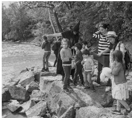
Die Kinder auf der Suche nach dem Inngeist.