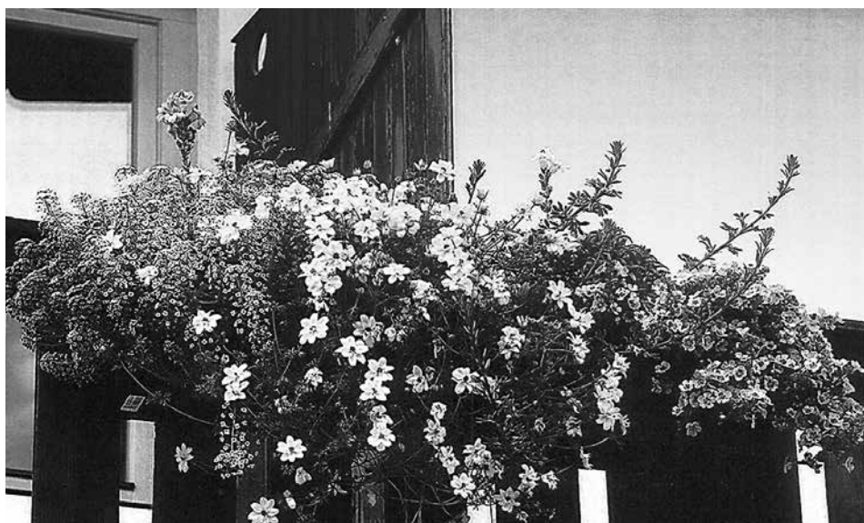
Bunter Balkon mit Duftsteinrich, Goldmarie, Löwenmaul, Fächerblume und Zauberglöckchen.