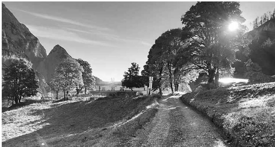
Bei St. Magdalena im Halltal.

Die Arbeiten beginnen voraussichtlich Mitte April und dauern je nach Witterung etwa acht Wochen.