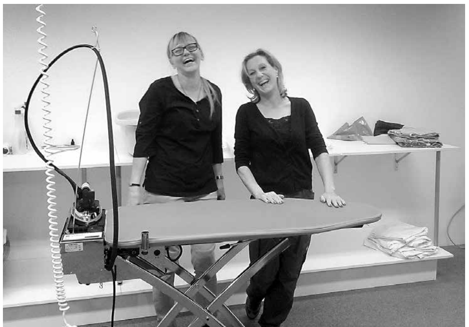
Gute Laune herrscht beim Emmaus-Team, das verschiedenste Dienstleistungen in Haus und Garten, u.a. auch einen Bügelservice anbietet.