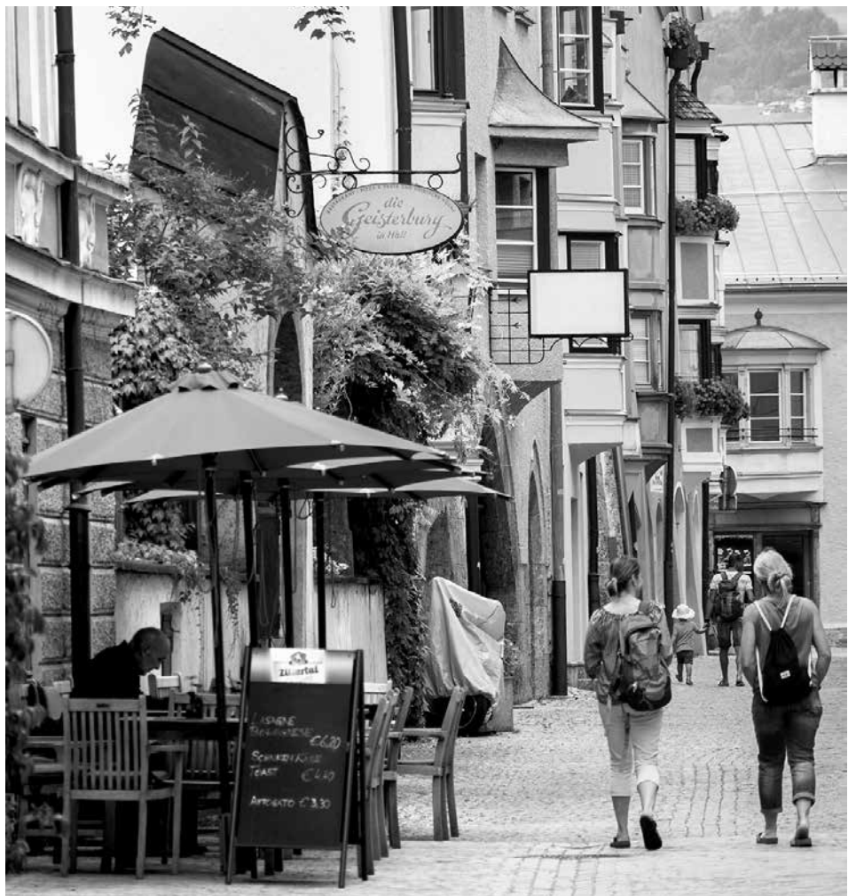
LokalbetreiberInnen soll die Nutzung öffentlicher Flächen in der Haller Altstadt auch heuer kostenlos ermöglicht werden.

Auch wenn derzeit noch keine fixen Termine für Veranstaltungen vereinbart werden können, die Vorbereitungen für Angebote und Aktionen in der Haller Altstadt laufen. Für den Leiter des Haller Stadtmarketings Hall, Mag. Michael Gsaller, eine organisatorische Herausforderung: „Sobald es die gesetzlichen Vorgaben ermöglichen, werden wir ein konkretes Programm für den Frühling bzw. Sommer erstellen. Aufgrund der Erfahrung des vergangenen Jahres können vermutlich neben dem Haller Bauernmarkt vor