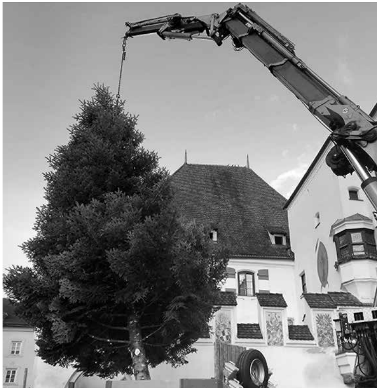
Beim Aufstellen des Baumes vor dem Haller Rathaus.

Vieles ist im heu- rigen Jahr anders – gleichgeblieben ist jedoch, dass vor dem Haller Rathaus ein wunderschöner Christbaum aufge- stellt wird.