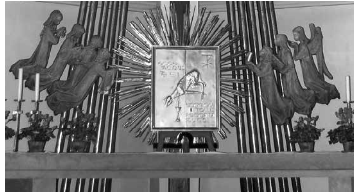
In den nächsten Wochen gibt es keine öffentlichen Gottesdienste.

"Die näheren Details werden noch in Abstimmung mit den anderen Kirchen und Religionsgesellschaften festgelegt, die dann wieder eine Vereinbarung mit der Regierung treffen werden", so Erzbischof Lackner. "Ähnlich wie beim Lockdown im Frühjahr werden die Kirchen für das persönliche Gebet offen bleiben", informierte Erzbischof Franz Lackner über die Grundzüge der geplanten Änderungen. "Öffentliche Gottesdienste und kirchliche Veranstaltungen werden aber weitestgehend und zeitlich befristet ausgesetzt. Gottesdienste können dann wie im Frühjahr nur in verschlossenen Räumen und im kleinsten Kreis stellvertretend für die Gemeinde gefeiert werden." Damit sei gesichert, dass die Eucharistiefeier stattfindet und man über die Medien mitfeiern kann. Darüber hinaus sei auch im Lockdown die seelsorgliche Begleitung von Kranken und Sterbenden weiterhin möglich. Der