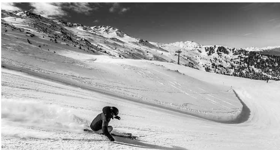
Voraussichtlich am 16. Dezember kann am Glungezer die Wintersaison starten.