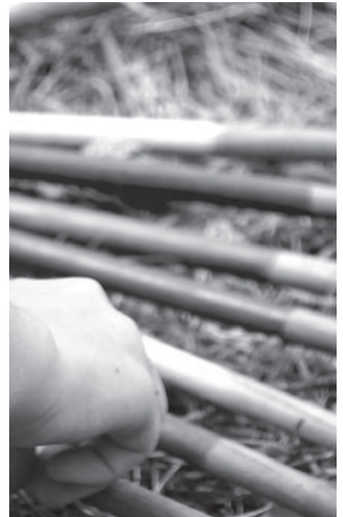
Aus dem Zeltlager wird heuer eine fünftägige Tagesbetreuung in Hall.

Übrigens war auch das erste Zeltlager, das die Pfarre Hall veranstaltete, eher ungewöhnlich. Im Jahr 1975 organisierte man es im Gleirschtal. Die Kinder mussten damals aber wegen starker Regenfälle und einer großen Mure evakuiert werden, mit einem Hubschrauber wurden sie ausgeflogen.