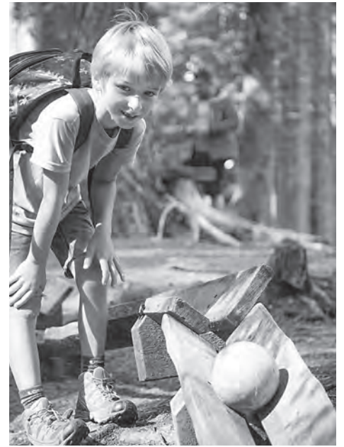
Im Kugelwald am Glungezer befindet sich die weltweit größte Holzkugelbahn.

Der Naturpark Karwendel, Österreichs größter Naturpark und Tirols größtes Schutzgebiet, bietet mit seinen wildromantischen Bergtälern und markanten Gipfeln ein ideales Terrain für bergbegeisterte Naturliebhaber. Viele Weitwanderrouten durchqueren die Region, so zum Beispiel der Traumpfad von München nach Venedig, der Karwendel-Höhenweg oder Etappen des be-