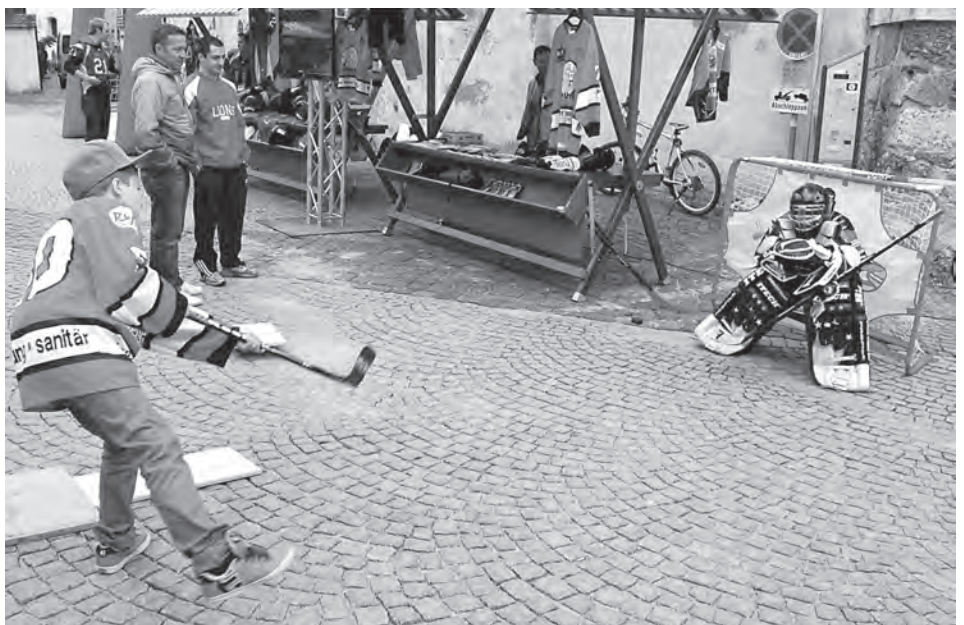
Vorschläge zur Bespielung und Belebung der Altstadt sind willkommen.