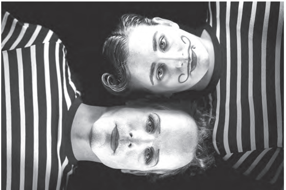
Im Kulturlabor Stromboli wird zum Brecht-Liederabend geladen.