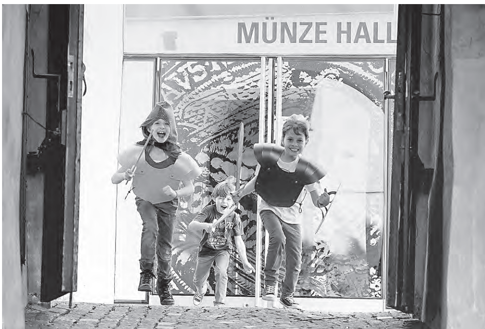
Ein Besuch in der Münze Hall macht auch Kindern Spaß.

Mehr Informationen zu den Angeboten in der Region Hall-Wattens unter www.hall-wattens.at