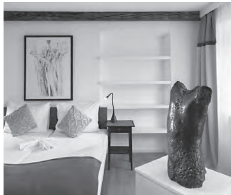
Arbeiten des Bildhauers Simone Turra sind in zwei der Gastzimmer ausgestellt.