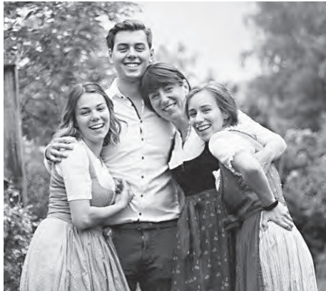
Familie Steiner.

Seit 1899 führt die Familie Steiner das Haus mit Herz und Begeisterung. Von den 25 Zimmern ist jedes anders und einzigartig. Zudem werden 14 Zimmer von renommierten Bildhauern mit ihren Werken bestückt und bereichert. Im Sommer wird abends bodenständig aufgekocht.