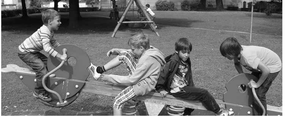
Möglichst viel Vergnügen soll Kindern bei den Spiel-mit-mir-Wochen ermöglicht werden.