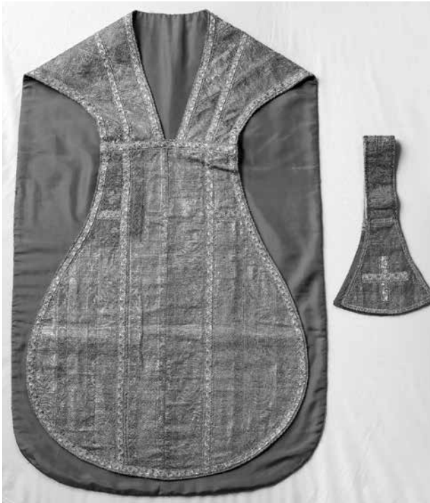
Kasel aus Seide, Stadtmuseum Hall.