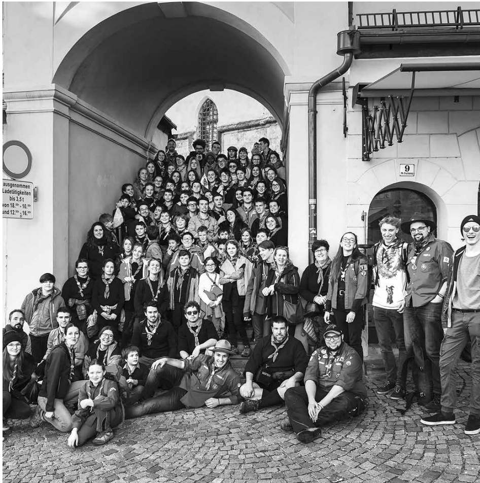
Haller PfadfinderInnen bekamen Besuch aus dem Trentino.

Am 22. Februar feierten die PfadfinderInnen zu Ehren ihres Gründers Baden-Powell den Thinkingday, an dem im Sinne der weltweiten Verbundenheit andere Gruppen besucht und selbstgebastelte Karten verschickt werden. Heuer konnten sich die Haller PfadfinderInnen an diesem besonderen Tag über den Besuch von 120 Gleichgesinnten aus dem Trentino freuen.