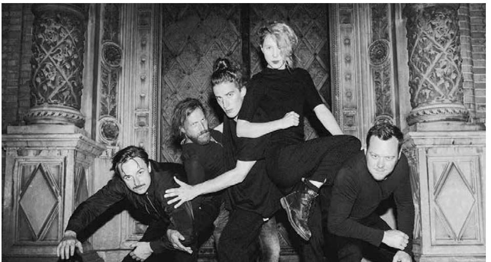
Die Band 5K HD gastiert im Stromboli.

noch mehr ins Detail zu gehen, noch hochauflösender zu werden, noch ins Ohr ziehendere Melodien zu finden und trotzdem unvorhersehbar zu bleiben, also den schmalen Grad zwischen eingängigem Pop und experimenteller Musik im 5K HD Universum zu definieren.