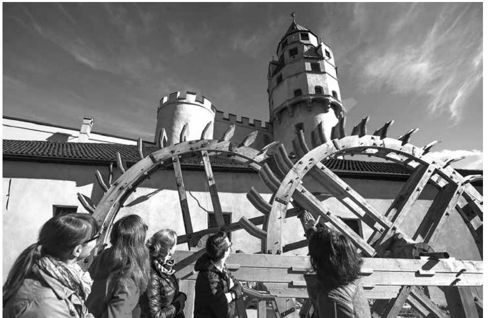
Die nachgebauten Wasserräder bei der Münze Hall veranschaulichen den historischen Antrieb.

Zudem werden eine Fahrt zu den Swarovski Kristallwelten und eine Abendführung in der Glockengießerei Grassmayr veranstaltet.