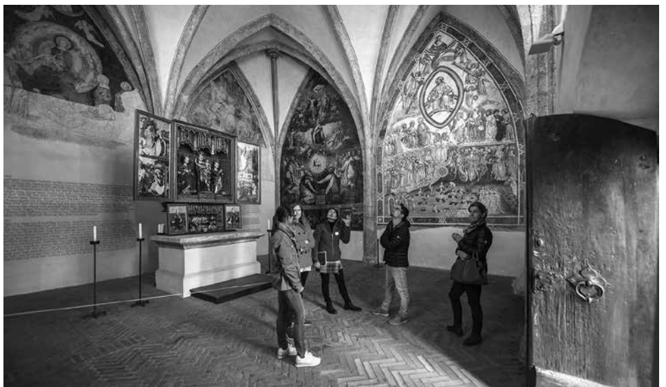
Die ursprünglich zweistöckige Magdalenenkapelle in der Altstadt (südlich der Stadtpfarrkirche St. Nikolaus) mit Fresken aus verschiedenen Epochen und einem gotischen Flügelaltar.