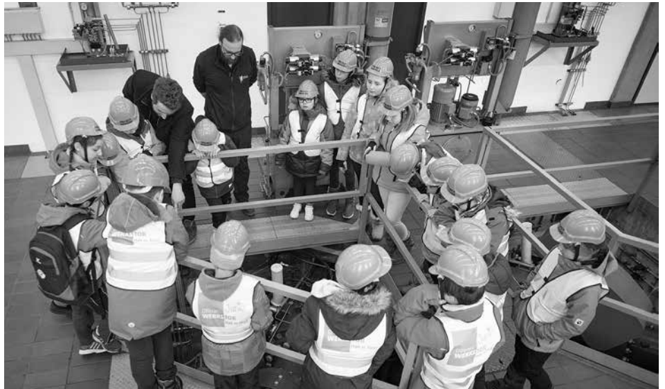
Offenes Werkstor Junior im Kraftwerk Volders der Hall AG.

Neugierige Wirtschafts-Spürnasen waren beim ersten "Offenen Werkstor Junior" zu Gast. Rund 20 Kinder konnten es kaum erwarten, mit Helmen und Warnwesten ausgerüstet zum ersten „Junior Werkstor“ aufzubrechen. Ziel der ersten Auflage: Das Kraftwerk Volders der Hall AG.