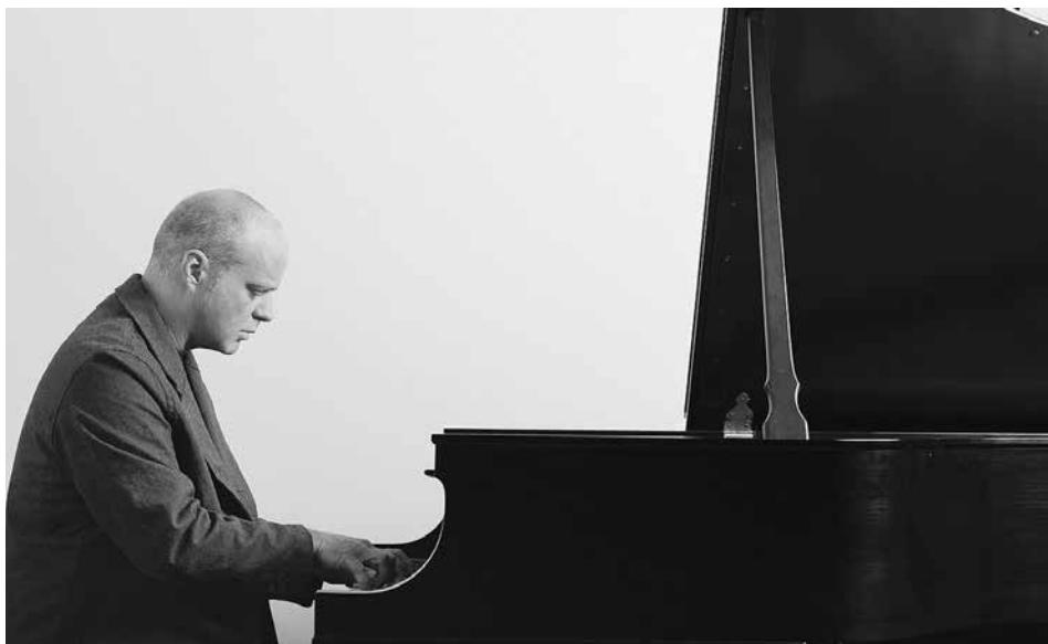
Jazzgröße John Medeski gastiert im Stromboli.

Im Rahmen der Stromboli-Saudades-Konzertreihe gastiert am Sonntag, 26. Jänner, ab 20 Uhr der Ausnahmepianist John Medeski aus den USA im Stromboli und gibt eines seiner seltenen Solo-Konzerte.