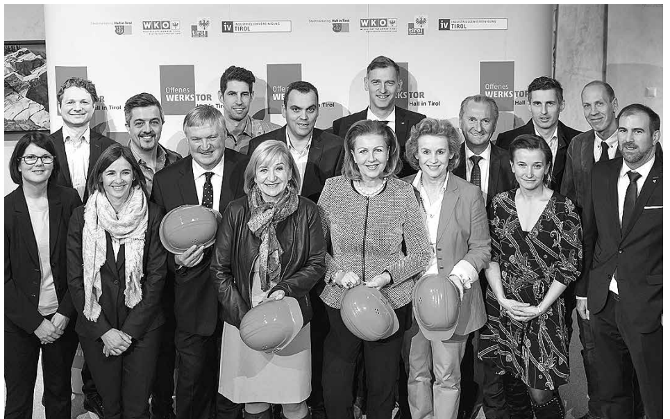
Organisatoren, Partner und teilnehmende Firmen freuen sich bereits auf den 26. März, wenn das 5. Offene Werkstor zum Blick hinter die Kulissen heimischer Betriebe bittet.

Nach einem „Facelifting“ erstrahlt das Kraftwerk Volders der Hall AG im neuen Glanz und wird im Rahmen des Offenen Werkstor Junior wieder der Öffentlichkeit präsentiert. Der erste Schritt zum Offenen Werkstor Junior ist die Anmeldung – diese muss online über das Formular auf der Website www.offeneswerkstor.at vorgenommen werden. Anmeldeschluss ist der 24. Jänner. Da nur eine begrenzte Anzahl von Plätzen zur Verfügung steht, wird die Teilnahme zugelost. Der Zeitpunkt der Anmeldung spielt innerhalb des Anmeldezeitraumes bei der Zuteilung somit keine Rolle, lediglich das Glück entscheidet. Nur mit einer schriftlichen Zusage (Boarding Pass), die bis spätestens 28. Jänner auf dem Postweg übermittelt wird, ist eine Teilnahme möglich. Die Tour wird von MitarbeiterInnen des Tourismusverbandes bzw. Stadtmarketings begleitet. Es wird gebeten, die Kinder durch einen Erziehungsberechtigten an den Reiseleiter