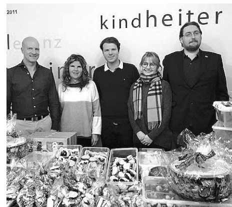
Zum Kekse-Paradies wurde dank des Lions Club Hall Armada das SOS-Kinderdorf Imst.

Geglüht haben in der Vorweihnachtszeit die Backöfen der Mitglieder des Lions Club Hall Armada.