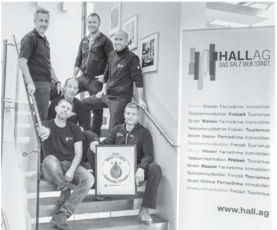
Das Team für Wasser & Wärme der Hall AG sorgt Tag und Nacht für ausgezeichnete Trinkwasserqualität in Hall.

Über die rund 70 Kilometer Versorgungsleitungen sowie 30 Kilometer Hausanschlussleitungen erhalten rund 15.000 Menschen sowie zahlreiche Betriebe das hochqualitative Wasser aus dem Berg. Damit werden in Hall rund 1,1 Millionen Kubikmeter Wasser pro Jahr genutzt.