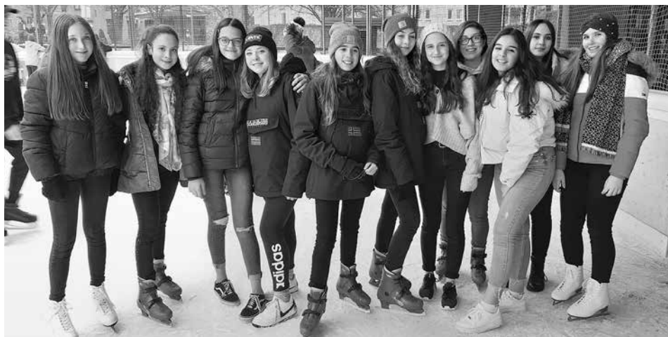
Gute Laune herrschte auch auf dem Eislaufplatz.