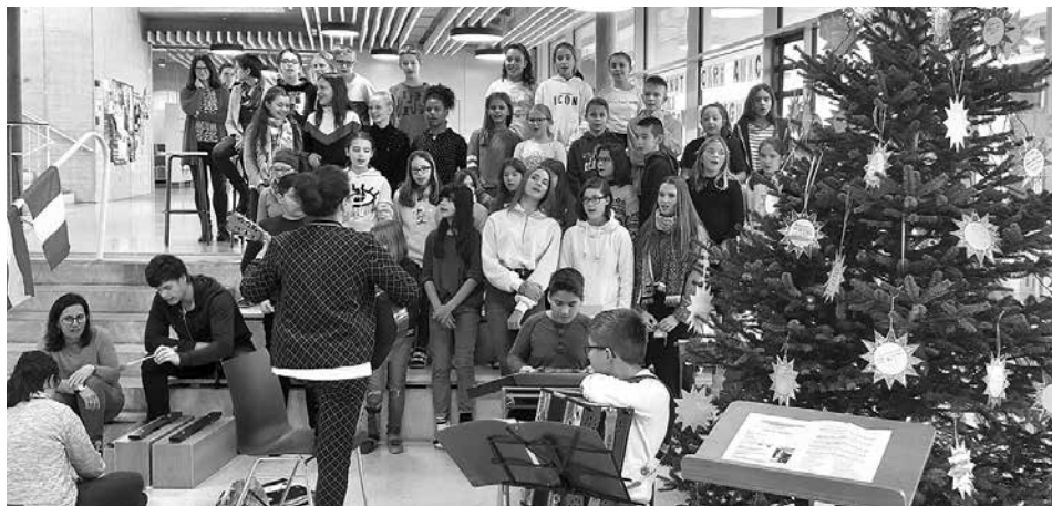
Die Begrüßung fand im weihnachtlich dekorierten Foyer des neuen Haller Schulzentrums statt.

Im Foyer des neuen Haller Schulzentrums gab es eine fröhliche Begrüßung der Gäste mit