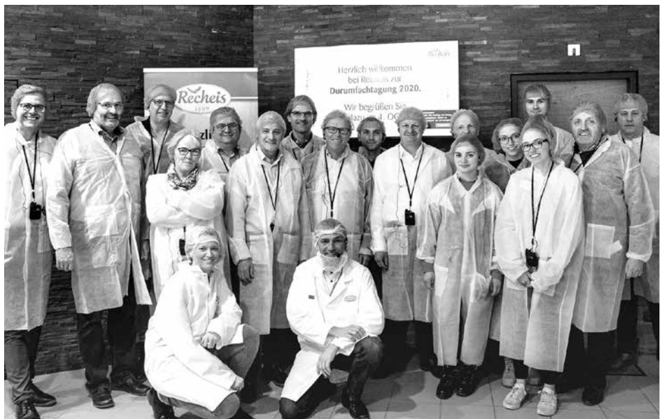
Die TeilnehmerInnen der Durum-Fachtagung, die heuer bei der Haller Firma Recheis abgehalten wurde.

Recheis arbeitet seit Jahren eng mit Wissenschaftlern und österreichischen Landwirten der Erzeugergemeinschaft Zistersdorf (EGZ) zusammen, um besondere Weizensorten verarbeiten zu können, welche die strengen Kriterien an Qualität und nachhaltige Landwirtschaft erfüllen. „Dieser internationale Branchentreff eignet sich perfekt dafür, alle Erkenntnisse rund um den Hartweizen