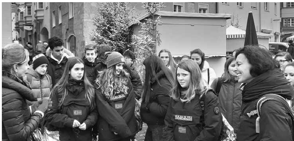
Für die italienischen SchülerInnen war der Haller Adventmarkt ein tolles Erlebnis.