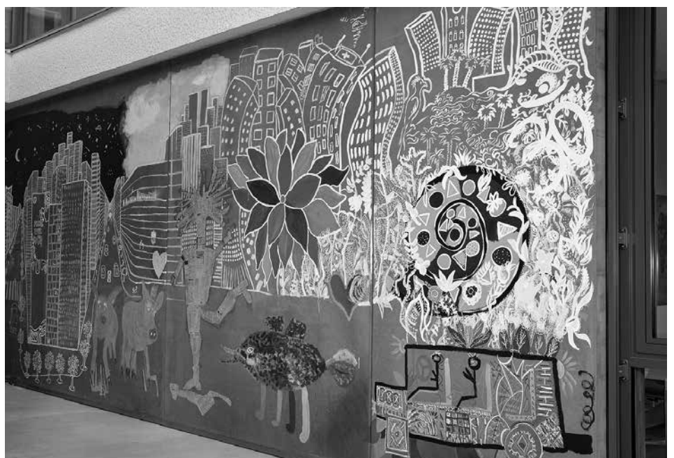
Der Neubau der Kinder- und Jugendpsychiatrie in Hall bekam eine kreativ gestaltete Sockelzone. Es war dies ein völlig neuartiges Projekt, bei dem PatientInnen mit Kunsttherapeutinnen und KünstlerInnen zusammen arbeiteten

Gemeinsam wurde kürzlich der Abschluss dieser Projektphase gefeiert.