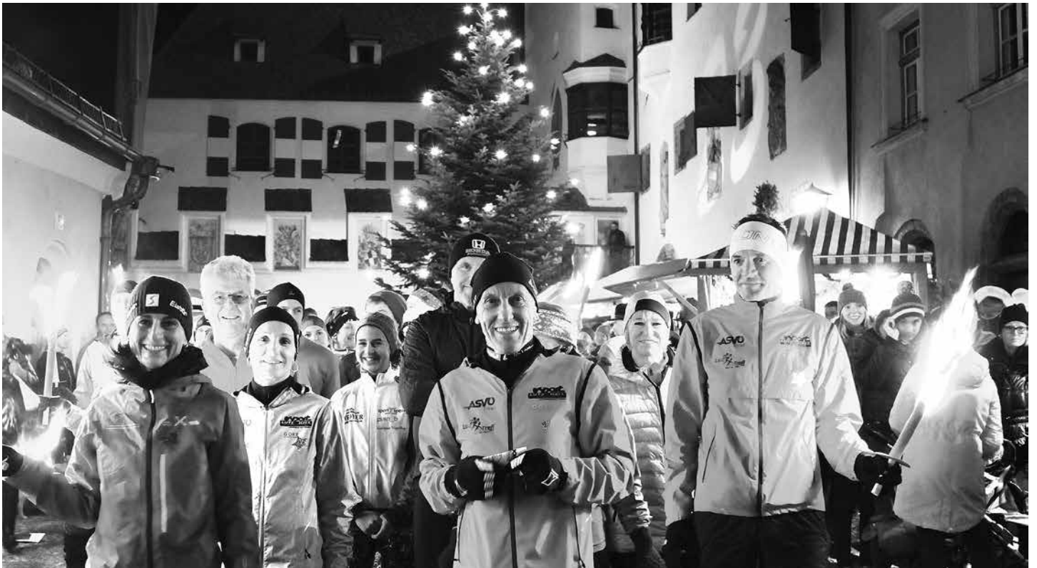
Der beliebte Sterntalerlauf am 8. Dezember startet und endet bei der UMIT, er führt durch die Haller Altstadt.