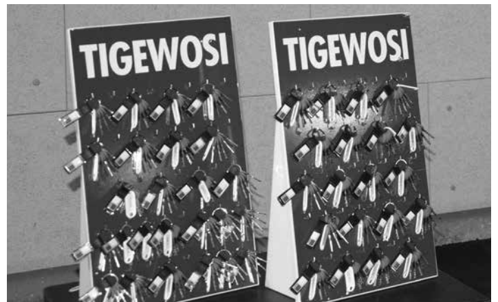
Schlüssel für 46 Wohnungen konnten ausgehändigt werden.