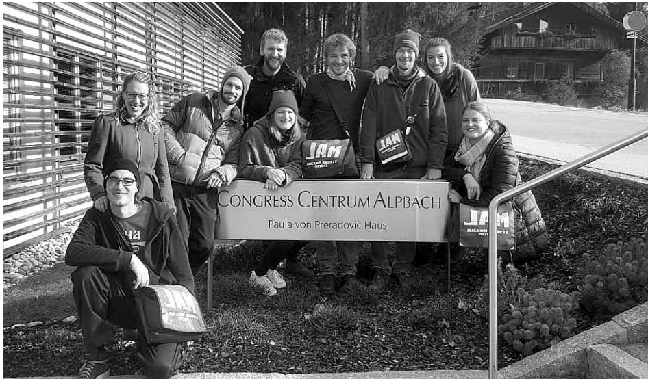
JAM-MitarbeiterInnen bei einer Fachtagung in Alpbach.

Das Team der Mobilien Jugendarbeit von JAM hat an der Fachtagung der BOJA (Bundesweites Netzwerk Offene Jugendarbeit) teilgenommen, das im November in Alpbach stattgefunden hat.