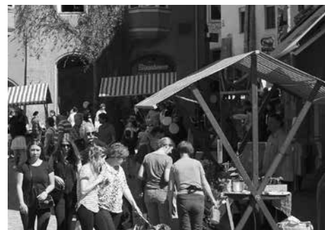
Für einige Wochen "übersiedelt" der Bauernmarkt an den Unteren Stadtplatz.

Der Haller Bauernmarkt ist das gesamte Jahr über ein beliebter Treffpunkt für den regionalen Einkauf in der Haller Altstadt. Auch im Winter sind die Bauern aus der Region jeden Samstag mit ihren Spezialitäten und Frischeprodukten vor Ort. Bitte beachten: Während der Zeit des Haller Adventmarktes, also zwischen 22. November und 24. Dezember, wird der Bauernmarkt am Unteren Stadtplatz, am Fuße des Langen Grabens, abgehalten.