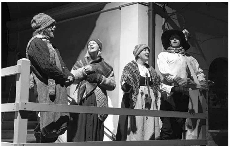
Um 18 Uhr wird dann am Eröffnungstag des Adventmarktes "Stille Nacht – eine Marktspielerei" gezeigt.