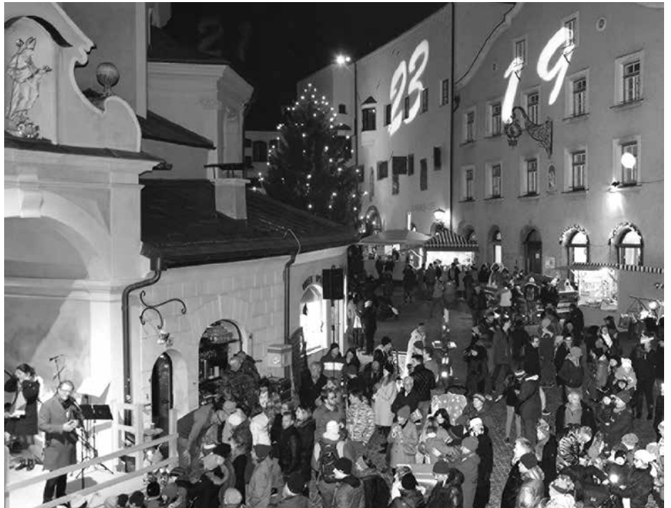
Am Freitag, 22. November, 17 Uhr wird der Adventmarkt feierlich eröffnet.