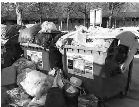
Nicht nur verschmutzte Sammelinseln sind ein Problem, auch Fehlwürfe kommen zu oft vor!

Auswirkungen der Fehlwürfe sind: Unnötig hohe Entsorgungskosten für Sammlung, Sortierung, Transport und Behandlung. Verpackungen werden zum Großteil händisch sortiert. Windeln