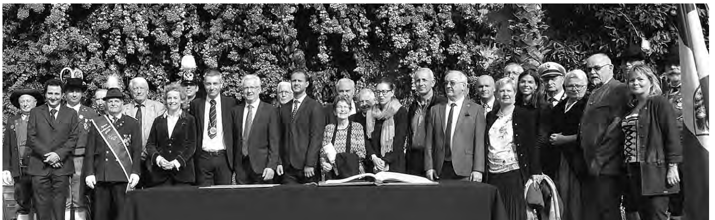
Bei strahlendem Wetter konnte in Arco der Freundschaftsvertrag gefeiert werden.