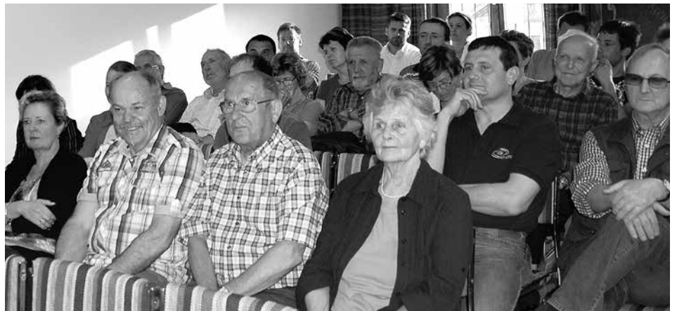
Stadtteilversammlungen wie hier in Heiligkreuz geben den Bürgerinnen und Bürgern Gelegenheit, sich zu informieren und auch selbst zu äußern.