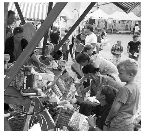
Am Oberen Stadtplatz gibts nachmittags einen Flohmarkt von und für Kinder.

Altersgenossen auf dem Openair-Flohmarkt handeln und feilschen. Für die Kinder bietet sich nicht nur Gelegenheit nach gebrauchten Spielsachen und Bekleidung zu stöbern, sie können auch den Umgang mit Kaufen und Verkaufen, Handeln und Tauschen üben. Die Eltern können ihnen dabei natürlich helfen. Angeboten werden viele tolle Dinge: Bücher, Spielzeug, Kleidung und vieles mehr.