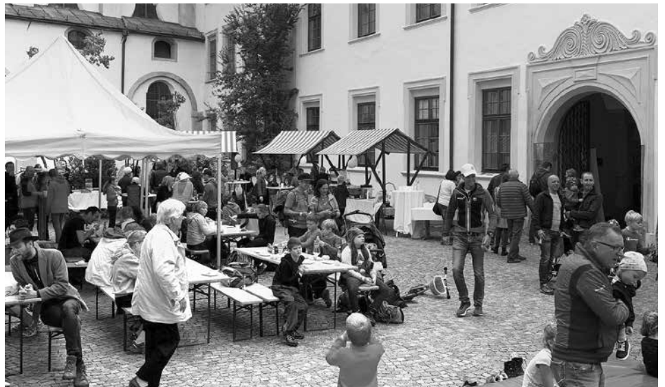
Der Haller Alpenverein konnte sich beim Tag der offenen Tür über großes Besucherinteresse freuen.

Ende September konnten unzählige Mitglieder und interessierte Besucher beim „Tag der offenen Tür“ die Sektion des Haller Alpenvereins in der Schulgasse besuchen.