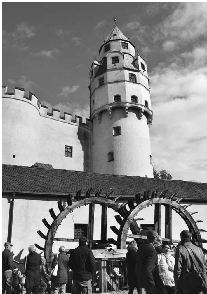
Einladend gestaltet wurde auch das unmittelbare Umfeld der beeindruckenden Wasserräder beim Haller Wahrzeichen, dem Münzerturm.

Technologie verbreitete sich in ganz Europa und galt für einen Zeitraum von über 180 Jahren als „state of the art“. Das Silberbergwerk in Schwaz, das von dem Handelshaus der Fugger betrieben wurde, ließ die Nachfrage nach Silbertalern sprunghaft in die Höhe schnellen. Der Bedarf an neuen Talern konnte durch die damals noch übliche händische Hammerprägung längst nicht mehr gedeckt werden. So begann man nach Wegen zu suchen, um die Prägung zu automatisieren. Erzherzog Ferdinand II. von Tirol (1529-1595) war ein großer Freund technischer Neuerungen. Unter ihm wurde nicht nur die Münze Hall von der Innenstadt in die Burg Hasegg verlegt, sondern auch die Walzenprägung eingeführt. Die Walzenprägemaschine, die mit Wasserkraft angetrieben wurde, kam erstmals 1571 in Hall zum Einsatz und ermöglichte die Massenprägung von Silbermünzen. Diese Form der Prägung war äußerst effizient und verschaffte dem Münzherrn einen wesentlichen Wettbewerbsvorteil. Die Münze Hall hatte somit als erste Münzstätte der Welt den Wechsel von einem Handwerksbetrieb hin zu einem Industriebetrieb vollzogen.