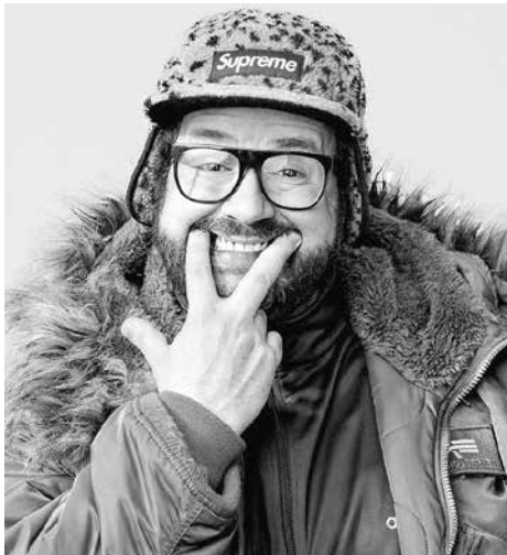
Oliver Polak.