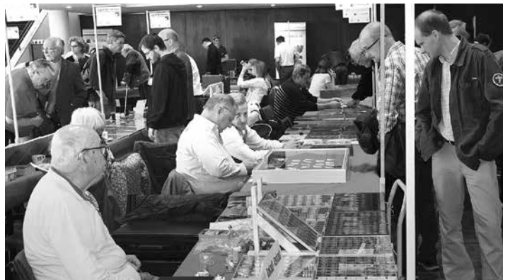
Hobby oder Expertentum – bei der Münzbörse gab es regen Austausch.

ExpertInnen der Tiroler Numismatischen Gesellschaft hatten sich zur Verfügung gestellt, um von den BesucherInnen mitgebrachte Münzen zu begutachten und zu schätzen. Auch dieses Angebot wurde reichlich genutzt.