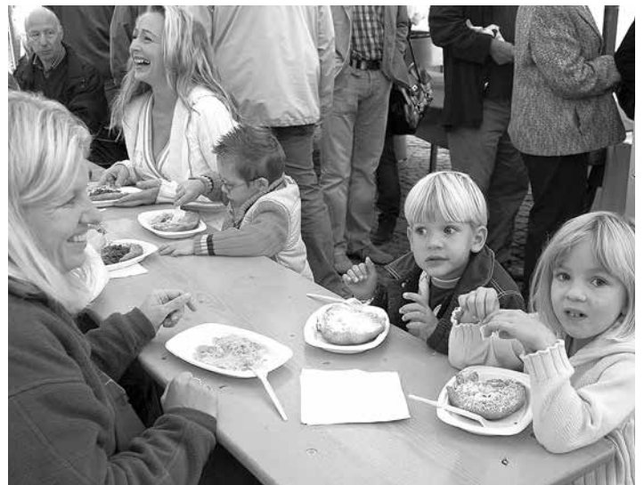
Für Kiachl können sich Große und Kleine gleichermaßen begeistern.

tet den FestbesucherInnen, die Möglichkeit, einfache Volkstänze zu erlernen. An einem Infostand kann man sich näher über die Haller Bindertanzgesellschaft und ihre Ziele informieren. Die Bindertanzgesellschaft erweitert dieses Kiachlfest übrigens auch um verführerische süße Apfeltaschen. Zur Jugendförderung gibt es auch heuer wieder einen Flohmarkt mit Sinn und Sach' wie Bücher, diverse Kunstgegenstände, alte Radios und Uhren.