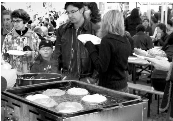
An zahlreichen Ständen am Stiftsmarkt erhält man köstliche Kiachl in allerlei Varianten – natürlich frisch herausgebacken.