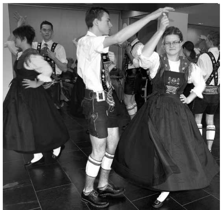
Der Haller Bindertanzgesellschaft ist Brauchtum ein wichtiges Anliegen, beim Kiachlfest bietet sie die Gelegenheit einfache Volkstänze zu erlernen.