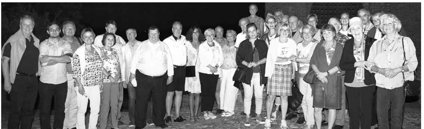
Die interessierte und gutgelaunte Reisegruppe der Münzfreunde hat das bestens organisierte Programm genossen.

Die Tiroler Numismatische Gesellschaft hatte im September zu einer Vereinsreise nach Oberitalien in die Städte Cremona, Parma und Piacenza geladen.