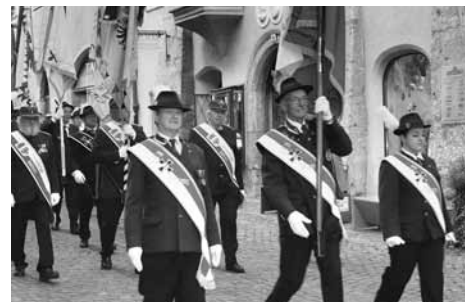
Auch ein Festzug durch die Stadt stand auf dem Jubiläumsprogramm.