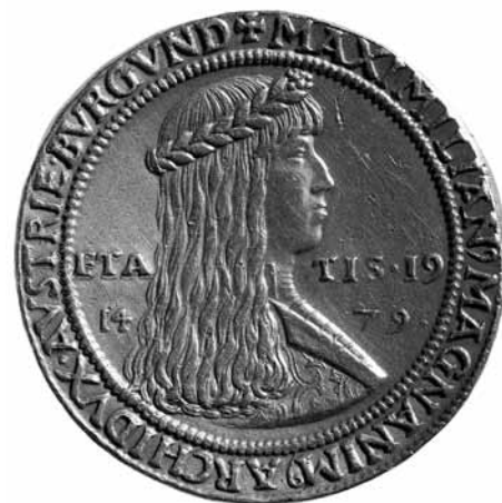
Münzen als Mittel der Propaganda sind ein Thema der Ausstellung in der Münze Hall.

Öffnungszeiten: DI-SO 10 - 17 Uhr; Schließtage: 1.11. / 22.12.-26.12. / 31.12. / 1.1.2020