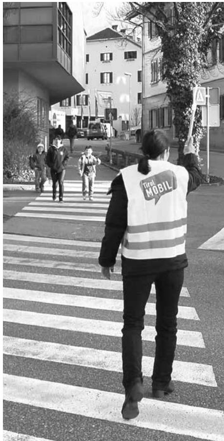
Der Schulweg bringt wichtige Kompetenzen.

Regnerische und dunkle Morgen sind ein Unfallrisiko auf dem Schulweg. Es ist daher besonders wichtig, auf die richtige Kleidung des Schulkindes zu achten. Sie soll möglichst hell sein, besonders wirkungsvoll erweist sich auch das Anbringen von Leuchtstreifen