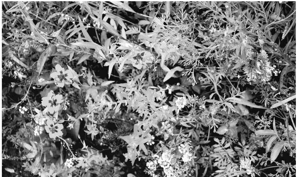
Naturnahe Blumenwiesen als kleine Naturoasen im Stadtgebiet.