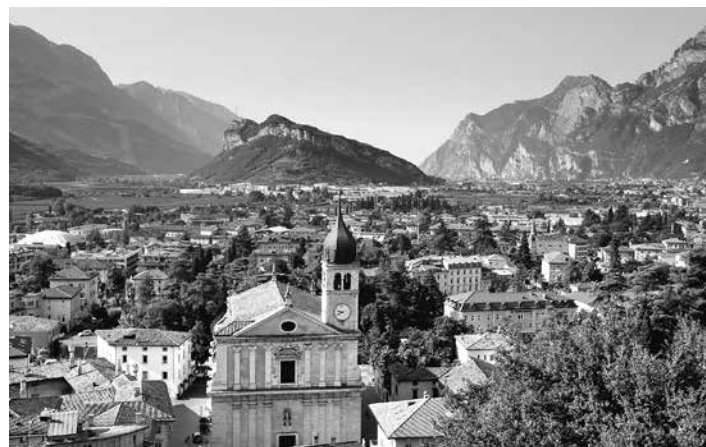
Die Pfarre St. Nikolaus Hall lädt zur gemeinsamen Fahrt nach Arco.

Folder mit genauen Informationen liegen am Schriftenstand in der Stadtpfarrkirche auf.