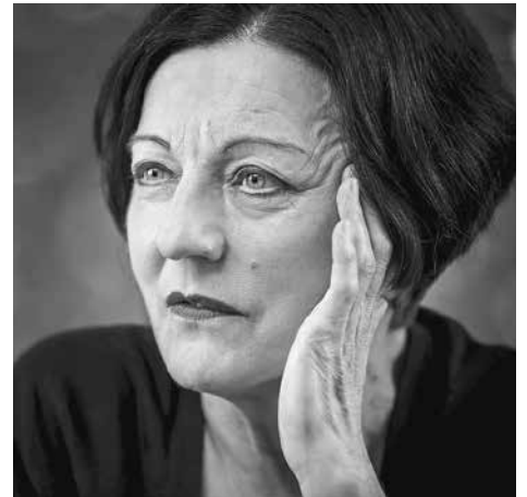
Literaturnobelpreisträgerin Herta Müller.

Auch wenn sich die Haller Literaturtage angenehm von Startrubel distanzieren, so kommt mit