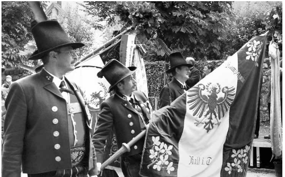
Auch im Jahr 2006 war das Bezirksschützenfest in Hall ein bestens organisiertes und gut gelungenes Treffen.

Die Speckbacher Schützenkompanie Hall begeht heuer – nach der Wiedergründung im Jahre 1934 – übrigens ihr 85-jähriges Bestehen.