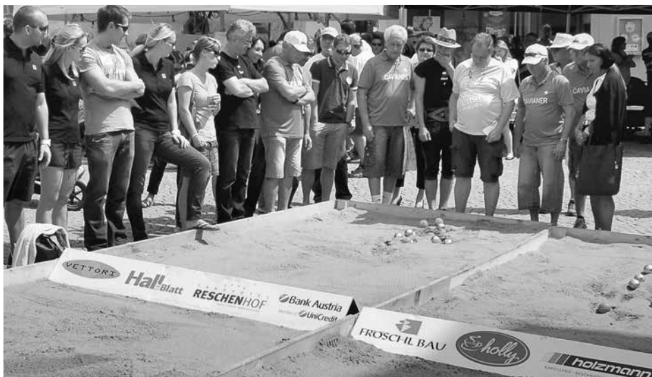
Das Boccia-Turnier wird auch heuer wieder am Stiftsplatz ausgetragen.

Die TeilnehmerInnen treffen sich bereits um 9.30 Uhr am Stiftsplatz, das Turnier startet dann pünktlich um 10 Uhr. Eine Bahn misst 2x8 Meter. Jede Mannschaft besteht aus 4 bzw. 5 Spielern und spielt mit acht Kugeln. Jeder Spieler darf max. zwei Kugeln werfen. Besteht eine Mannschaft aus 5 Spielern, darf somit jeder Spieler 0, 1 oder 2 Kugeln werfen. Das Haserl muss in das letzte Drittel der Bahn geworfen werden und muss mindestens 30 cm vom seitlichen Rand, mindestens 50 cm von der Stirnseite und mindestens 50 cm von der Sponsorbande, die in der Mitte der Bahn liegt, entfernt liegen bleiben.