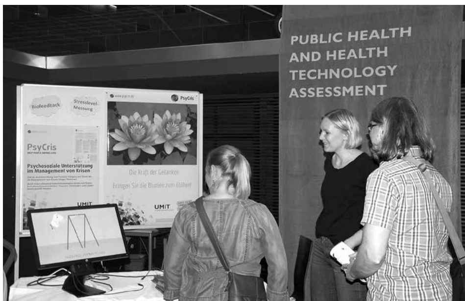
Die UMIT bietet ein attraktives und zukunftsorientiertes Studienprogramm im Gesundheitswesen und der Technik.

Informationen über das Studienangebot der UMIT erhalten Sie auch unter www.umat.at , lehre@umat.at oder unter Tel. 050 8648-3817.