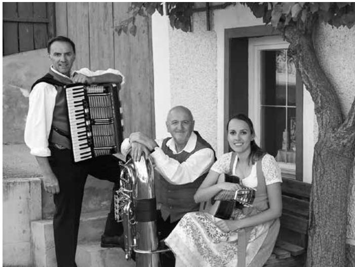
Die "Dreiviertel Musig".