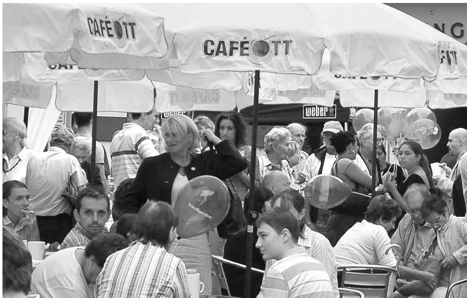
Am Samstag, 10. August am Haller Stiftsplatz: Das TT-Café.

TT-Abonnenten können sich außerdem als kleines Dankeschön für ihre Treue ein Geschenk mit nach Hause nehmen (solange der Vorrat reicht) und die TT-Fotostation sorgt für persönliche Erinnerungsbilder.