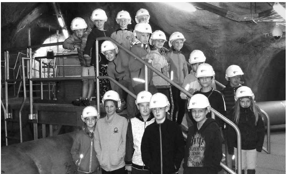
Erfahren, wo das Trinkwasser herkommt: Die Führung im Wasserstollen begeisterte die Kinder.