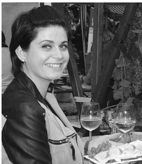
"Zum Wohl" heißt es beim Haller Weinherbst.

Freitag, 17 - 21 Uhr: Jakob Bergmann & Musikanten Samstag, 11 - 14 Uhr: Bio Trio Tirol; 14 - 17 Uhr: Die 3 Stromlosen; 17 - 21 Uhr: Die Selberbrennt'n