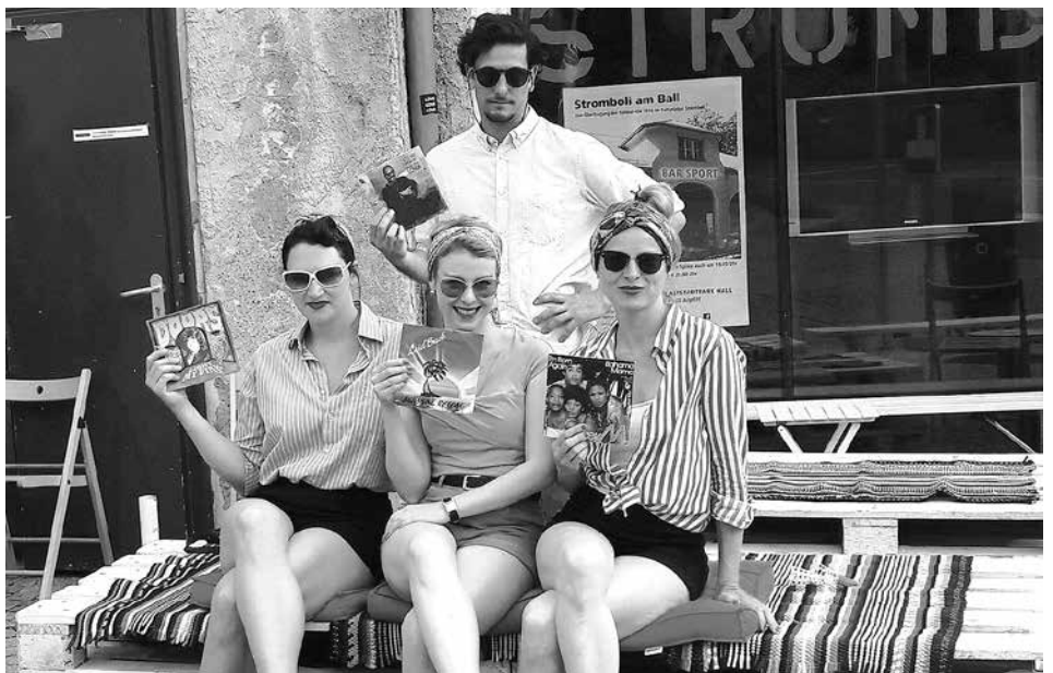
Alles andere als "Hits(e)frei" geht es bei "Tanzen wie früher" in einen herrlichen Sommerabend.

steht ab 20 Uhr "Tanzen wie früher" auf dem Stromboli-Programm. Denn das Kulturlabor hat absolut nicht Hits(e)frei, vielmehr gibt es dort nämlich wirklich richtig Sommer – ein Sommer