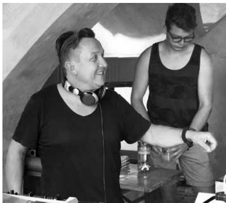
The Waz exp. lädt zur „hottest party in town“.

Und als ob der Dancefloor unter freiem Himmel nicht schon heiß genug wäre, geht es ab 23 Uhr noch mit DJ Tax im Stromboli weiter. Eine Woche später, am Samstag, 3. August,