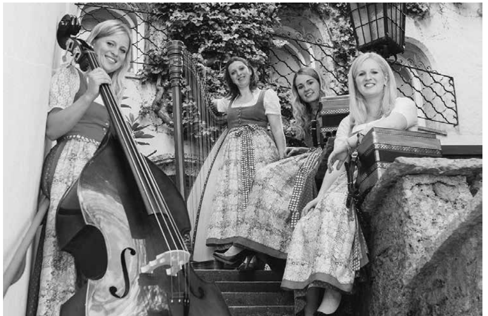
Ob gemütlich an einem Ort sitzen bleiben oder die einzelnen Gastgärten hintereinander aufsuchen – Musikgenuss ist auf jeden Fall garantiert. Im Bild die "Blusnknepf".