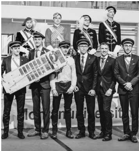
Bei der Preisverleihung am Pennälertag in Leoben.

Dieser Bundespreis geht an Korporationen, die sich in ihren Angeboten nicht nur an ihre eigenen Mitglieder, sondern zusätzlich noch in besonderem Maße an die Öffentlichkeit richten. Dabei konnten die Nibelungen sowohl mit einem zeitgemäßen Fort- und Weiterbildungsprogramm, sowie gelebtem Engagement für die Stadt Hall, für kirchliche und karitative Einrichtungen punkten, als auch