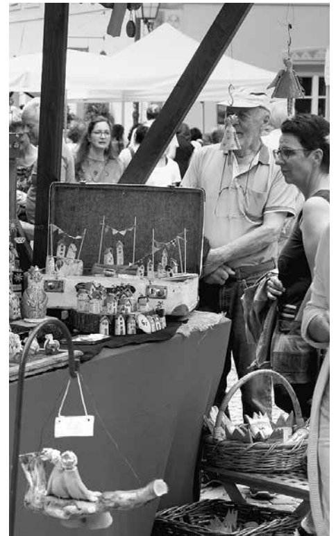
Die Kunsthandwerkerinnen setzen sich mit den unterschiedlichsten Materialien auseinander.

Viel feine Musik gibt es an diesen beiden Tagen: Freitag von 15 bis 18 Uhr: Duo Acoustic Chocolate; Samstag von 10 bis 13 Uhr: SAXOFEMMES+ und von 13 bis 16 Uhr Rockoustic.