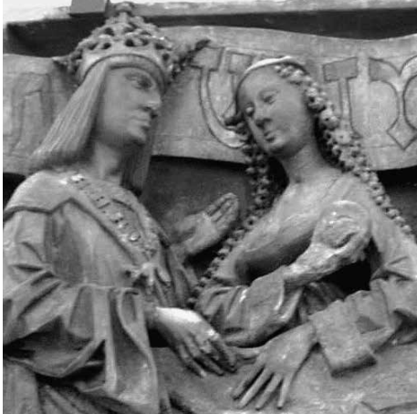
Kaiser Maximilian mit seiner zweiten Frau Bianca, Relief (Detail) am Goldenen Dachl in Innsbruck.

Die Stadtgemeinde Hall möchte alle EinwohnerInnen der Stadt mit Namen Maximilian oder Bianca herzlich einladen, bei einer Stadtführung Spannendes und Interessantes zu ihren berühmten Namensvettern zu erfahren.