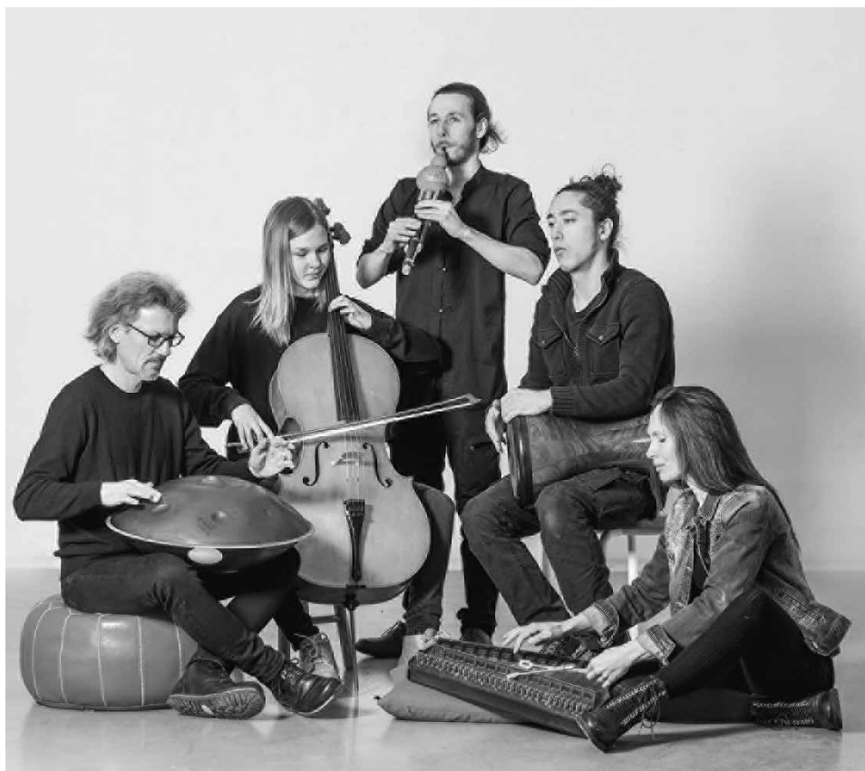
Das Ensemble "Innanna"

Als Eintritt werden freiwillige Spenden gerne entgegen genommen.