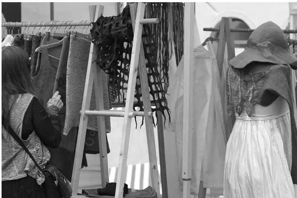
Zwei Tage lang kann man sich bei der "Weiblichen Welt" an Kreativem erfreuen und unter den vielen Einzelstücken das Passende suchen.