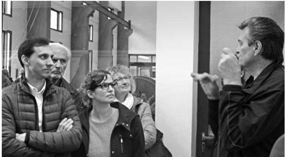
Mitarbeiter der Hall AG werden mit kompetenten Informationen zum Kraftwerk aufwarten.

Die größte Stromerzeugungsanlage der Hall AG, unweit der Karlskirche in Volders, nutzt das Wasser des Voldertalbaches und versorgt mit einer Jahreserzeugung von 33,5 Mio. kWh rund 10.000 Haushalte mit sauberer elektrischer Energie. Das Wasser für das Kraftwerk wird auf einer Seehöhe von 1.200 m aus dem Voldertalbach entnommen, weiter über den Stollen zum Tagesspeicher geführt und über die Druckrohrleitung zum Krafthaus geleitet. Dort produzieren zwei Maschinensätze sauberen Strom, der anschließend in das Stromnetz der Hall AG eingespeist wird. Dank des unterirdischen Speicherbehälters zwischen Stollen und Druckrohrleitung kann das Kraftwerk auch zur