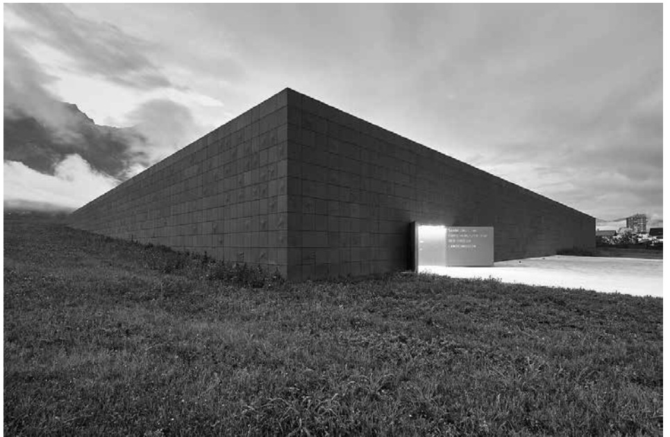
Das Sammel- und Forschungszentrum, geplant von Franz&Sue.