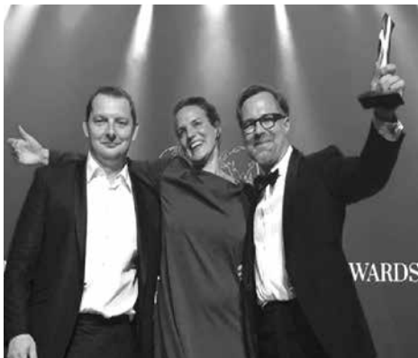
Bei der Preisverleihung in Moskau.

Im Vorjahr erhielt das Projekt bereits den FIABCI Prix d'Excellence Austria und ging beim internationalen Wettbewerb in der Kategorie