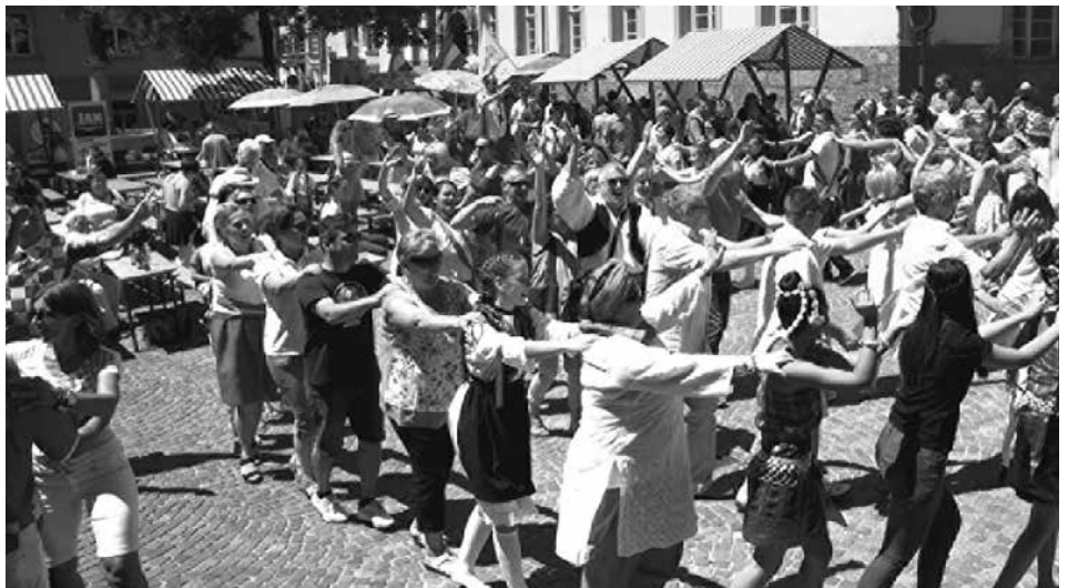
Bunt, fröhlich und gemeinsam: "Treffpunkt Bühne" findet bereits zum vierten Mal statt.

Menschen aus über 80 Staaten der Welt leben