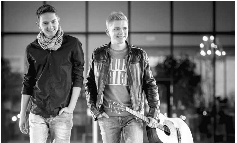
Zweikanalton.

ner Ikone geworden. Conchita Sieg beim Eurovision Song Contest 2014 in Kopenhagen ist unvergessen! Die Liebe zur Verwandlung und zu großen Gefühlen sind garantiert, wenn Conchita bekannte Pop-Balladen und hingebungsvolle Diven-Songs meisterlich interpretiert. Melodien, Bilder und Geschichten werden neu zusammengesetzt. Klassiker wie „Rise like a Phoenix“ werden natürlich nicht fehlen, auch „Have I ever been in Love“ oder „Heroes“. Mit im Gepäck für das Haller open-air sind aber auch einige frische, elektronische Sounds, die Conchita Wurst in zwei Kunstfiguren teilen. Ein sympathischer Abend mit fesselnder Live-Musik und pointiertes Entertainment. Einlass: 19 Uhr, Beginn: 20.30 Uhr.