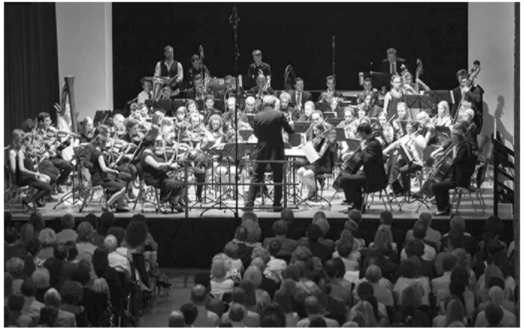
Das Orchester HALLegro konzertiert im Kurhaus Hall.