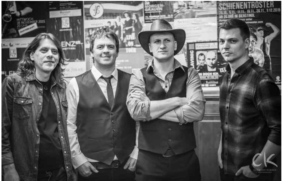
The Western Country Band.

Auch in diesem Jahr wartet der Haller BurgSommer mit einem ganz großen Star und einem Open-Air-Konzert auf. Der Hofratsgarten, in dem kürzlich der Circo Paniko gastierte, wird zur großen Bühne, wenn Conchita am Sonntag, 23. Juni beim BurgSommer auftritt. Conchita / Tom Neuwirth hat sich klaren Geschlechterzuschreibungen schon immer entzogen und ist damit zu ei-