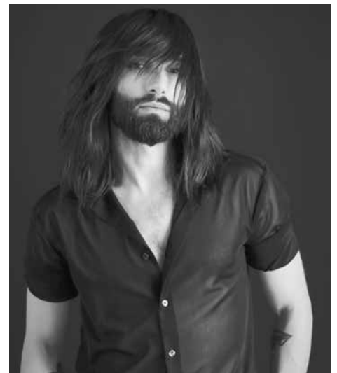
Conchita.

ner Ikone geworden. Conchita Sieg beim Eurovision Song Contest 2014 in Kopenhagen ist unvergessen! Die Liebe zur Verwandlung und zu großen Gefühlen sind garantiert, wenn Conchita bekannte Pop-Balladen und hingebungsvolle Diven-Songs meisterlich interpretiert. Melodien, Bilder und Geschichten werden neu zusammengesetzt. Klassiker wie „Rise like a Phoenix“ werden natürlich nicht fehlen, auch „Have I ever been in Love“ oder „Heroes“. Mit im Gepäck für das Haller open-air sind aber auch einige frische, elektronische Sounds, die Conchita Wurst in zwei Kunstfiguren teilen. Ein sympathischer Abend mit fesselnder Live-Musik und pointiertes Entertainment. Einlass: 19 Uhr, Beginn: 20.30 Uhr.