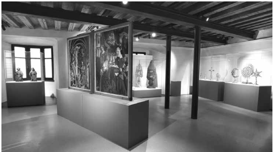
Im Hauptraum der Ausstellung u.a. zu sehen: die sogenannten Marx-Reichlich-Tafeln.

Den TeilnehmerInnen wird eine Führung durch die Waldauf-Kapelle mit Infos zur Stiftsgründung, den dazugehörigen Gebäuden und der Haller Heiltumsschau geboten, es folgt eine Führung durch die Ausstellung in der Burg Hasegg. Im Anschluss (ca. um 19.30 Uhr) wird der Begleitband zur Ausstellung präsentiert, der im Stadtmuseum, im Kulturamt der Stadt Hall und bei Fa. Riepenhausen um 13 Euro erhältlich ist.