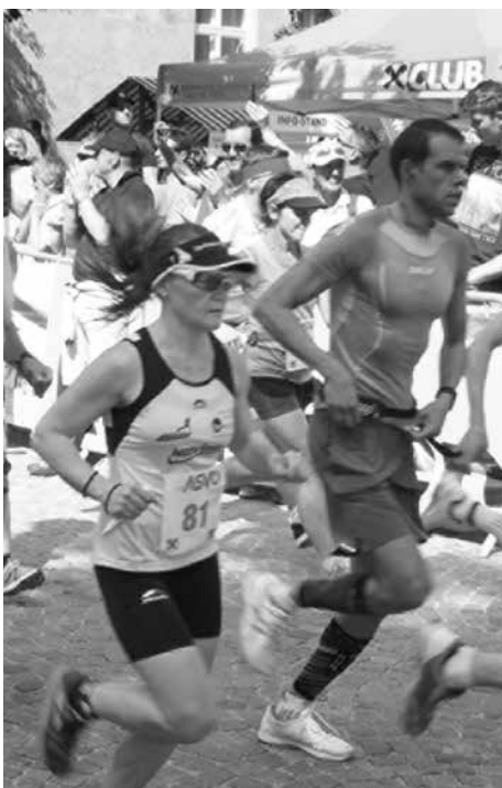
Größtes Lauffevent in der Region: Der Halbmarathon Hall-Wattens.

Streckenchef Gerhard Rampl schildert seinen Einsatz: "Kurz vor dem Halbmarathon fahre ich mit der Polizei noch einmal die Runde, um zu schauen, ob die Absperrungen und Beschilderungen passen. Da steigt natürlich die Anspannung, denn etwaige Probleme müssen dann sehr rasch und unkompliziert gelöst werden. Seit einigen Jahren sperren und beschildern wir erst am Morgen des Renntages, damit der Verkehr bis dahin ungehindert fließen kann. Im Anschluss an den Lauf werden alle Absperrungen