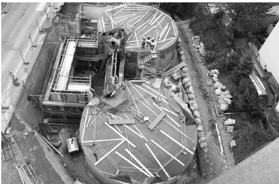
Baustelle Hochbehälter Halltalerhof von oben.

Der Hochbehälter Halltalerhof ist ein sogenannter Brillenbehälter. Insgesamt besteht die Anlage aus zwei Wasserkammern und einer vorgebauten Schieberkammer, die über den aufgesetzten Hochbauteil Zugang zu beiden Kammern bietet. Der Wasserstand erreicht bei maximaler Befüllung eine Höhe von 2,9 m. In