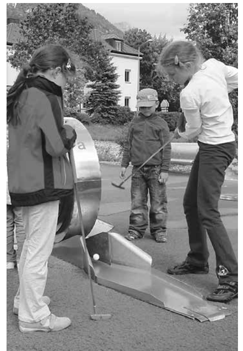
Gemeinsam mit anderen Kindern macht ein Ferientag noch viel mehr Freude.

Auch in den kommenden Sommerferien werden Haller Kinder bestens betreut. Die beliebten Haller Spiel-mit-mir-Wochen bieten jedem Kind ein spannendes und altersgerechtes Programm. Das Angebot richtet sich an Haller Kinder im Alter von 3 bis 14 Jahren. Die Kinder werden im neuen Haller Schulzentrum untergebracht.