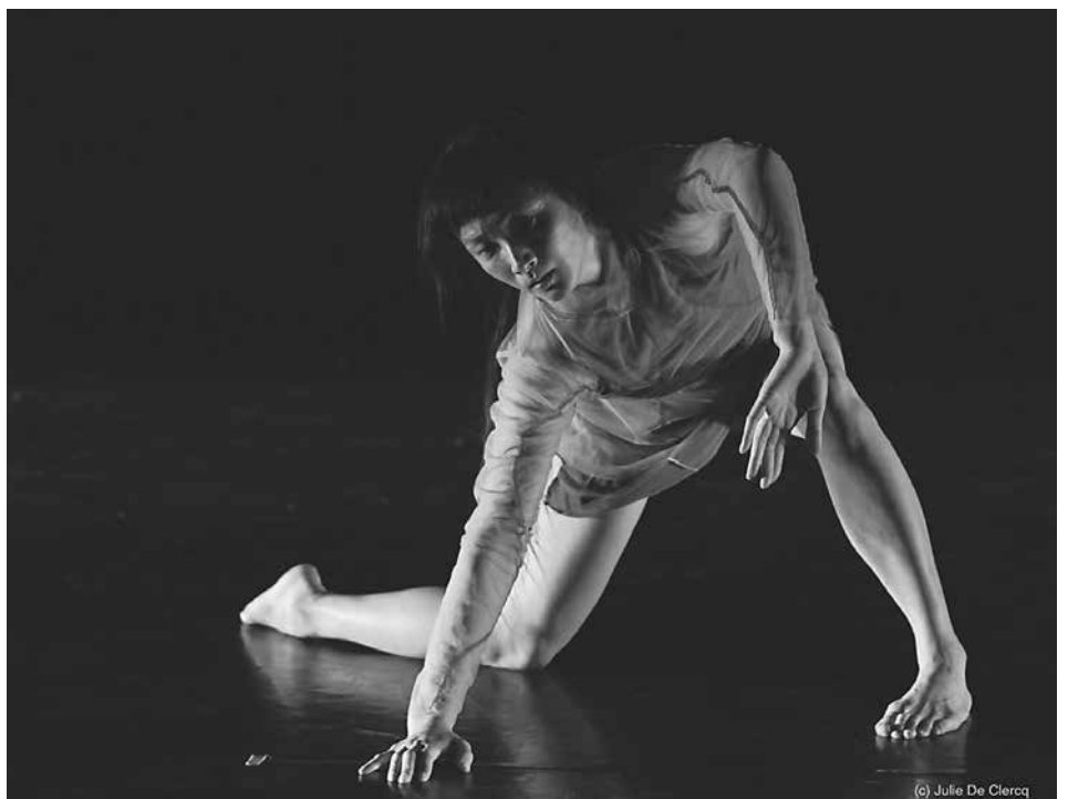
"I put a spell on you" – am Abend des Palmsonntag im Haller Salzlager.