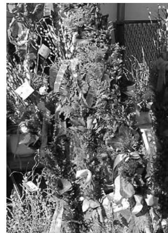
Gemeinsam geht das Aufputzen der Palmbuschen leichter von der Hand.

Der Familienverband Schönegg lädt auch heuer wieder ganz herzlich zum gemeinsamen Palm-Buschen-Binden am Samstag, 13. April, von 13 bis 16 Uhr ins Pfarrzentrum St. Franziskus / Schönegg ein. Bitte Gartenschere, Palmstangen und evt. vorhandenen Bindedraht mitbringen! Ölzweige, Palmkätzchen und sonstiges Grünes sowie Draht und Bänder sind vorhanden. Für die Materialien wird um einen kleinen Unkostenbeitrag gebeten, der einem sozialen Zweck zugute kommt.