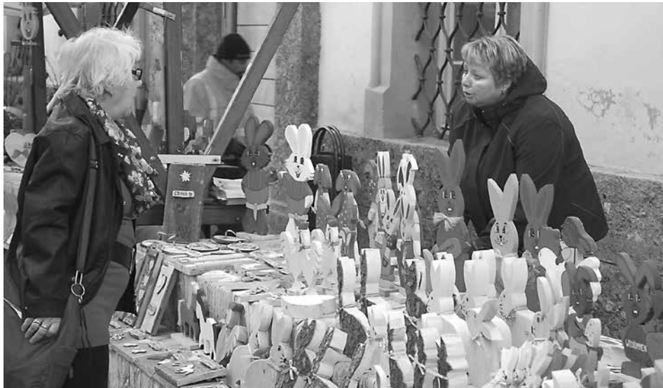
Alles für das Osterfest bietet der bunte Haller Ostermarkt am Stiftsplatz.

Zu einem Osterwunderland voller Überraschungen wird der Stiftsplatz am 12. und 13. April beim Haller Ostermarkt.