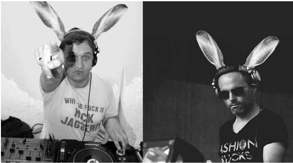
Bunter können Soundmixes nicht sein: Hoppy Easter Party mit Soudkillaz.

The Waz exp. und derAlte beschenken die Stromboli-Gäste auch heuer mit einem Osternest voller bunter Soundmixes: Soundkillaz am Samstag, 20. April, 20 Uhr.