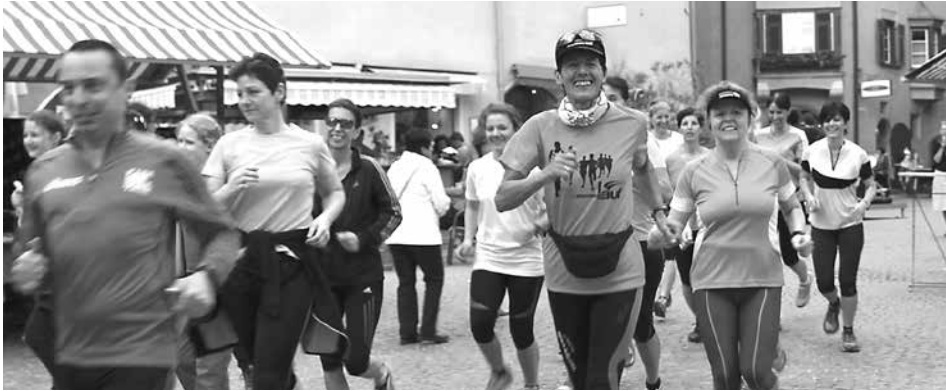
Gemeinsam laufen macht mehr Freude.

Der Lauftreff ist eine Gruppe von bewegungsfreudigen Menschen, die gerne in lockerer Runde für ca. eine Stunde dem Körper etwas Gutes tun wollen ohne sich jedoch zu überfordern. Saisonstart des heurigen Lauftreffs ist am Dienstag, 2. April, um 19 Uhr am Oberen Stadtplatz.