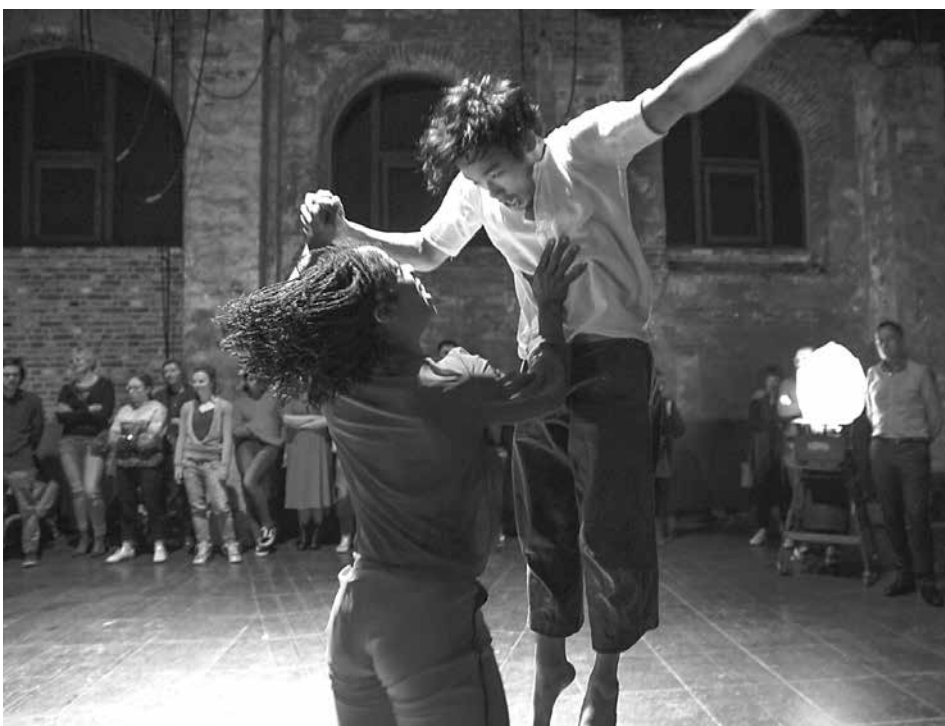
Ultima Vez präsentieren im Salzlager "Go Figure Out".

fünf verschiedene Charaktere auf das Publikum. Das Auge betrachtet – aus der Nähe, aus der Ferne. Jeder macht sich sein eigenes Bild, die Grenzen zwischen Performer und Zuschauer verschwinden. Durch die freie Bewegung im Raum werden auch die Zuschauer Teil eines kollektiven Geschehens. Choreographie: Wim Vandekeybus.