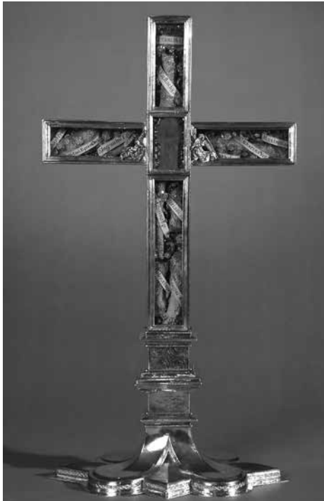
Reliquienkreuz, um 1500.

Ausstellungsdauer: 29. März bis 27. Oktober 2019. Öffnungszeiten: freitags, samstags und sonntags, jeweils von 10 bis 17 Uhr. Eintritt frei.