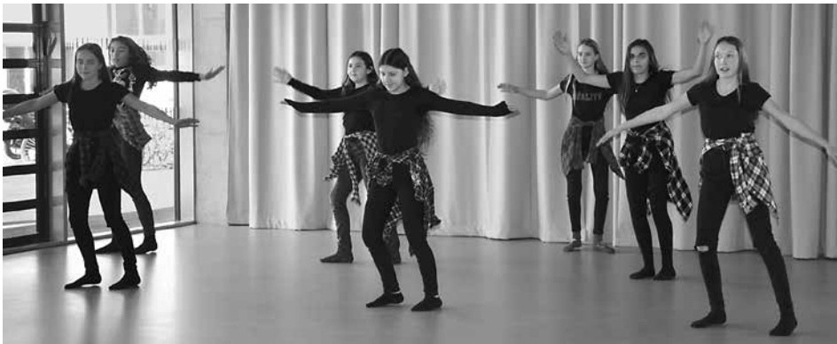
Schwungvolle rhythmische Darbietungen gab es von den SchülerInnen beim Eröffnungs-Festakt.

Der Bau, als "Clusterschule" konzipiert, wurde vom Architekturbüro "fasch&fuchs" geplant. 350 SchülerInnen und 60 Lehrkräfte hauchen nun diesem Gebäude schulisches Leben ein. Beim Festakt gab es neben der musikalischen Umrahmung durch "Four Brass" auch eine Musik- und Tanzdarbietung durch SchülerInnen und nach der Führung durch das Haus noch ein gemütliches Beisammensein.