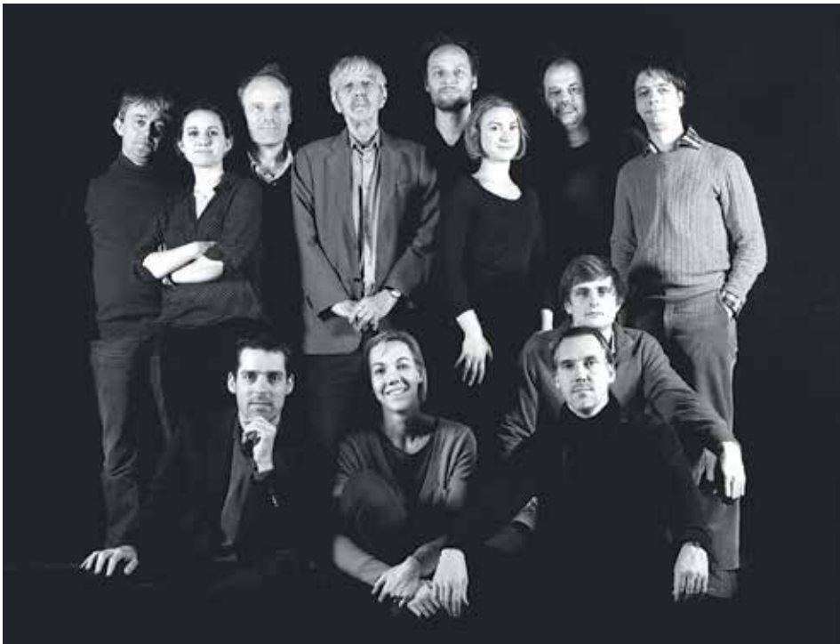
Das Het Collectief gestaltet den Auftaktabend des heurigen Osterfestivals.

Am Sonntag, 7. April, werden dann um 20.15 Uhr ebenfalls im Salzlager Ultima Vez – eine von Wim Vandekeybus 1986 gegründete Tanzcompany – mit Wort, Musik und Tanz das Publikum über unvorhersehbare und aufregende Wege in eine andere Welt führen. Bei "Go Figure Out Yourself" treffen im unbegrenzten Raum