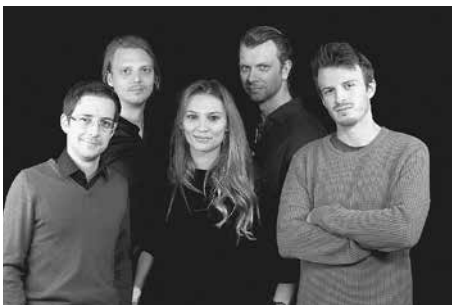
Wayne Shorter Story