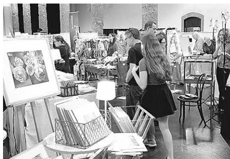
Kreative Fülle so weit das Auge reicht, bietet die Kunsthandwerkmesse "KreARTiv".

Im Mittelpunkt steht das Unikat, das unverwechselbare Einzelstück. Material und Technik werden in enormer Vielfalt gezeigt: Holz-, Glas-, Papier-, Metall- und Textilkunst, Leder, Taschen,