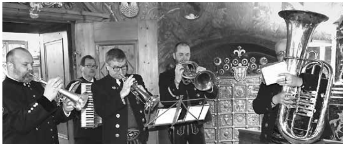
Ein Quintett aus Musikern der Speckbacher Stadtmusik und der Salinenmusik Hall umrahmt die Feierstunde im Rathaus,