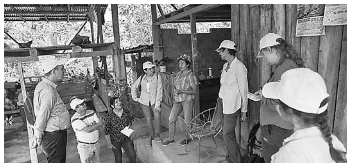
Zu Besuch auf einer Farm in Peru.