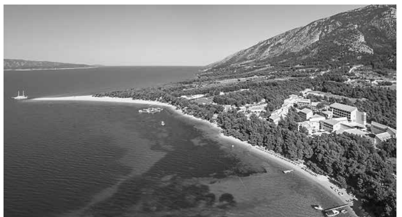
Das BRETANIDE Sport & Wellness Resort auf der Insel Brac, direkt am Zlatni Rat, einem der schönsten Strände Kroatiens.

Im neuen Flugreisekatalog für Kroatien bietet GRUBER-reisen gezielt die begehrten Urlaubsdestinationen in Mitteldalmatien an. Neben der Insel Brac sind auch die Insel Hvar sowie das Festland wie die Makarska