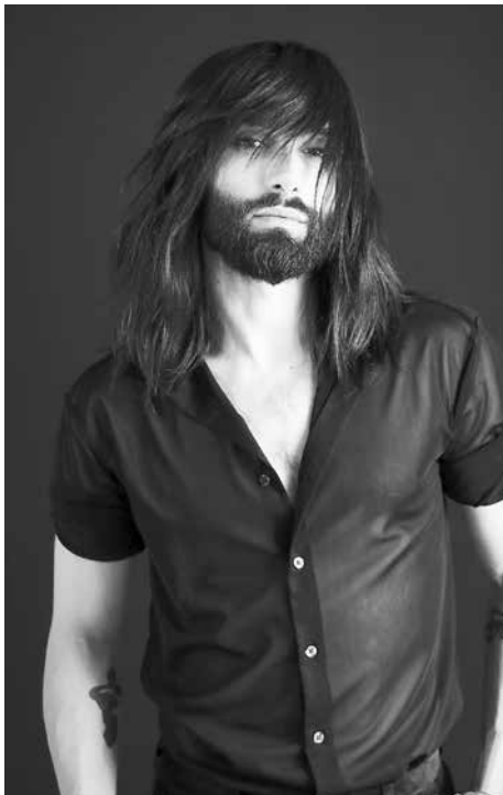
Tom Neuwirth alias Conchita.