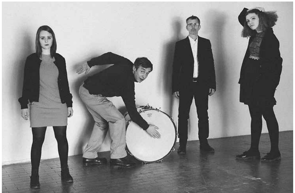
Binder & Krieglstein.

Am Samstag, 2. März, trifft im Stromboli ab 21 Uhr Jazz auf Soul mit Pop und Elektronik sowie etwas Folk und volkstümliche Klänge.