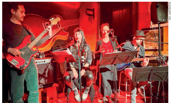
Counts&Peers: Pop- und Rock-Hits, gesungen von zwei starken Frauenstimmen.

Die Haller Gastgarten Wandermusik ist eine Initiative vom Stadtmarketing Hall in Tirol in Zusammenarbeit mit dem Rathauscafé, der Bar Centrale, dem Café Roseneck und dem Café im Zeindlhaus.