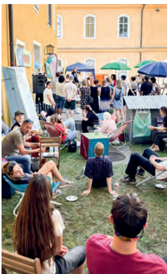
Der Vorplatz wurde zur gemütlichen Open-Air-JAM-Partyzone.