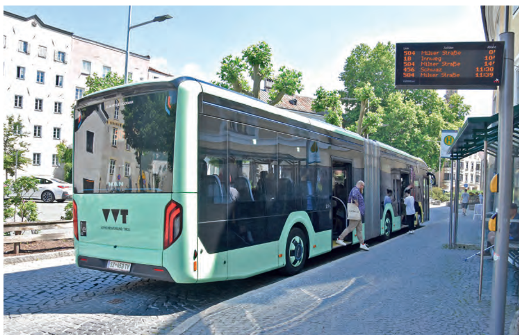
Die gesamte Busbucht am Unteren Stadtplatz bedarf einer neuen Pflasterung. Die Haltestelle wird nach Osten verlegt.

Aufgrund der nötigen Sperre der Busbucht muss die Haltestelle um ca. hundert Meter nach Osten auf die B171 verlegt werden. Hier wird während der Bauphase die Verkehrsinsel im Bereich der Volksschule und ehemaligen Haltestelle reaktiviert. Die benachbarten