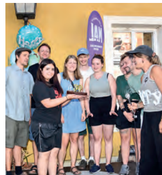
Ein Geburtstagsständchen samt Torte durfte natürlich auch nicht fehlen.