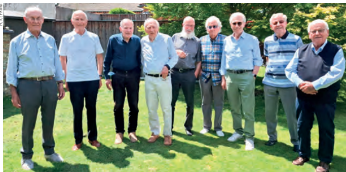
Die neun Mitglieder des Maturajahrgangs 1958 freuten sich über ein Wiedersehen.