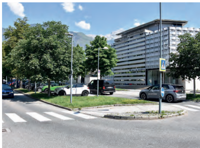
Die nördliche Richtungsfahrbahn am Stadtgraben wird im Juli saniert werden.

Von Seiten der Stadtgemeinde wird um Verständnis für die während der Sommerferien durchzuführenden Arbeiten gebeten. Die Monate Juli und August wurden gewählt, da aufgrund der Urlaubszeit mit weniger Verkehrsaufkommen zu rechnen ist.