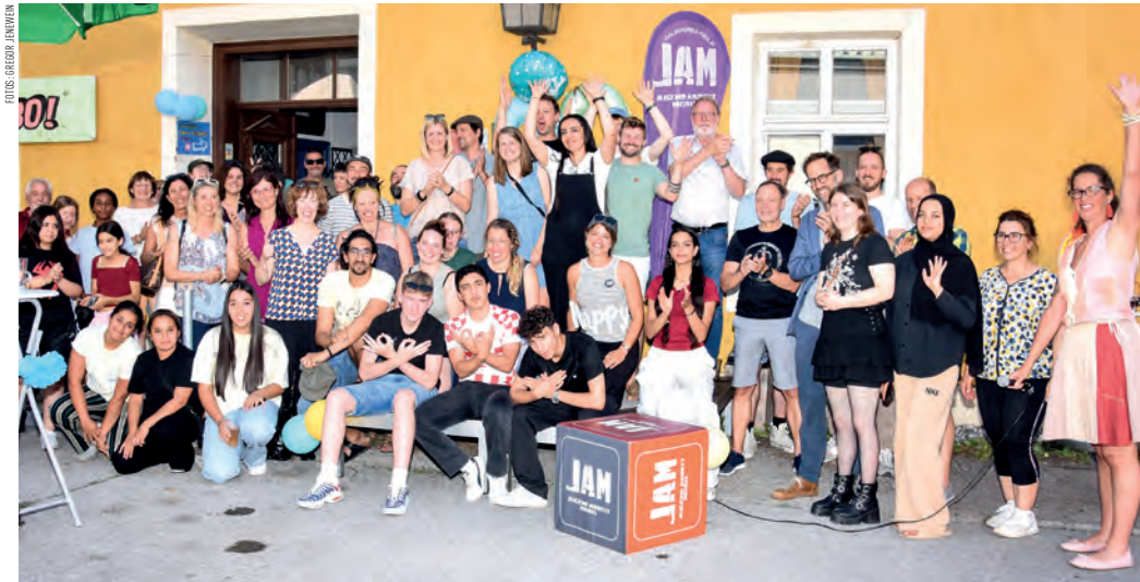
Aktive und ehemalige MitarbeiterInnen, politisch Verantwortliche und Gäste feierten gemeinsam den runden Geburtstag.