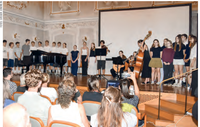
Mit gemeinsamen Liedern wie „Hevenu Shalom Alechem“ und den „Moorsoldaten“ erinnerten die SchülerInnen an die Schicksale der JüdInnen.

BILDUNG. Im Barocken Stadtsaal stellten die SchülerInnen das Ergebnis eines Projektes vor, dass sie über das gesamte Jahr hinweg beschäftigt hatte und das ihnen und den zahlreichen anwesenden Eltern, LehrerInnen und Gästen in Erinnerung bleiben wird. Für dieses Projekt wurde intensiv recherchiert. Die SchülerInnen haben in diesem Rahmen u.a. eine Synagoge besucht und an einer Führung im Jüdischen Friedhof in Innsbruck teilgenommen. Die Resultate dieser fächerübergreifenden Arbeit wurden nun öffentlich vorgestellt. Dazu bedienten sich die SchülerInnen unterschiedlicher Stilmittel, so wurde musiziert, gesungen, vorgetragen, gedichtet und schauspielerisches Talent im Rollenspiel bewiesen. Nie vergessen wurde im Zuge dieser Präsentation die Tragik und Bedeutung