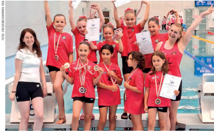
Strahlende Kinderaugen und ein glückliches Trainerteam jubelten.