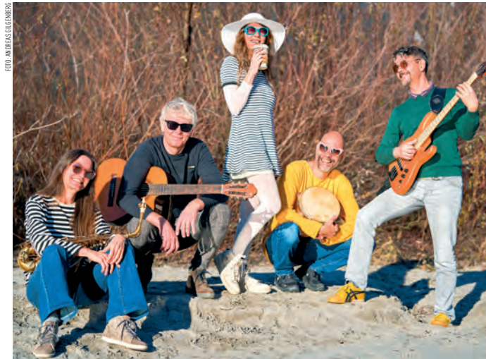
Die Tiroler Band Aruanda gibt sich am Samstag, 11. Juli im Gastgarten die Ehre.