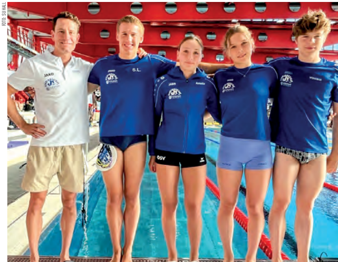
Vierköpfiges Team der Schwimmunion samt Trainer in der Bundeshauptstadt.