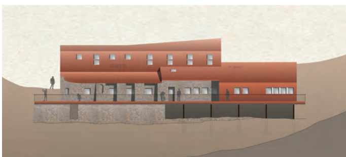
VISUALISIERUNG: ARMIN NEURAUTER