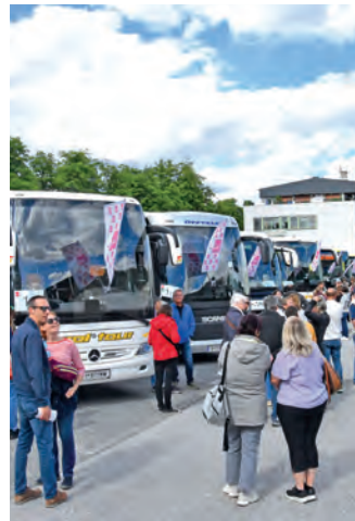
Zehn Busse brachten die 500 TeilnehmerInnen pünktlich und sicher zu den zehn „Offenen Werkstören“.