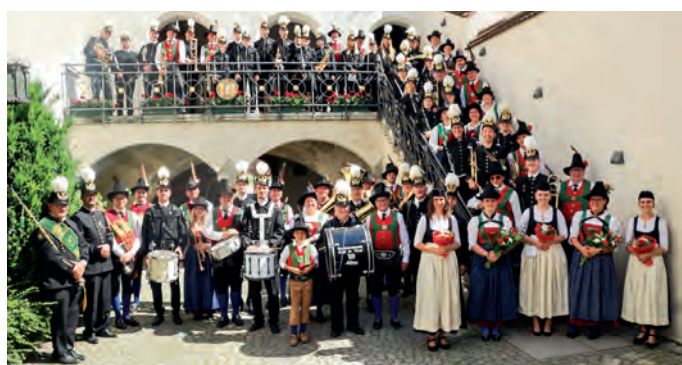
Speckbacher Stadtmusik und Salinenmusik Hall freuen sich auf diesen Festtag.

Organisiert von der Speckbacher Stadtmusik und der Salinenmusik Hall bringt diese Veranstaltung junge Menschen aus der Region und darüber hinaus zusammen, um die Freude an der Musik und die Verbundenheit zur Tradition zu teilen. Der Blasmusiktag beginnt um 10 Uhr mit einem Sternmarsch