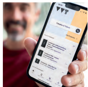
VVT App Workshops werden für Öffi-NutzerInnen kostenlos angeboten.

Um den Umgang mit den digitalen Angeboten des VVT zu erleichtern, werden kostenlose Schulungen angeboten. Geschulte TrainerInnen helfen bei der Installation der App und gehen alle Funktionen Schritt für Schritt durch. Die Schulungen richten sich dabei an alle – egal, wie versiert man im Umgang mit dem Smartphone und den beiden Apps ist. Im Fokus stehen die VVT