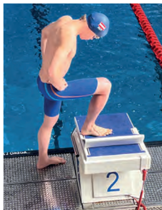
Mit voller Konzentration auf den Startblock und das Rennen.

wenige Wochen später steht das ganz große Ziel für die Jahrgänge 2010 und jünger an – die Österreichischen Nachwuchsmeisterschaften in St. Pölten. Bis dahin bleiben noch einige Wochen intensiver Vorbereitungszeit, um den Feinschliff für die nächsten Titelkämpfe zu holen.