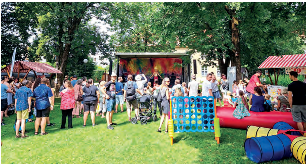
Beim Treffpunkt Bühne präsentieren sich KünstlerInnen aus aller Welt und natürlich dürfen Spaß und Kulinarik nicht fehlen.

Am Samstag, 20. Juni von 10 bis 15 Uhr laden der Verein KOMM ENT Hall-Integration und das Stadtmarketing Hall in Tirol erneut zu einem vielfältigen Fest der Kulturen und Begegnungen ein. Veranstaltungsort werden Altstadtpark, Bachlechnerstraße und Rathaus Hof sein.