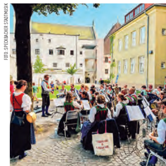
Die Speckbacher Stadtmusik Hall freut sich auf viele ZuhörerInnen.

KULTUR. Im schönen Ambiente der Altstadt spielt die Speckbacher Stadtmusik am Sonntag, 14. Juni um 17:30 Uhr ein frühlingsmüßliches Konzert für die ganze Familie. Bei freiem Eintritt werden am Platz am Marktanger unterhaltsame Konzertstücke zum Besten gegeben, Instrumente vorgestellt und das Wochenende musikalisch ausgeläutet. Kommen Sie vorbei und genießen Sie Live-Musik.