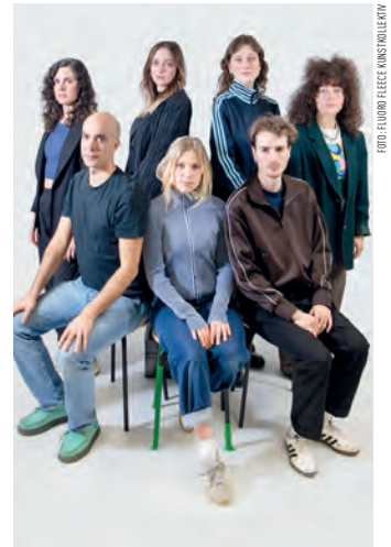
Fluoro Fleece Kunstkollektiv (FFKK)

Die Art Box ist ein ganz neuer Bereich des Museums, für dessen Gestaltung die Klocker Stiftung ein eigenes Stipendium ins Leben gerufen hat. Junge NachwuchskünstlerInnen und frische AbsolventInnen von Akademien und Kunsthochschulen bekommen die Möglichkeit im Zuge einer vierwöchigen KünstlerInnenresidenz