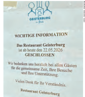
Verabschiedung per Aushang.