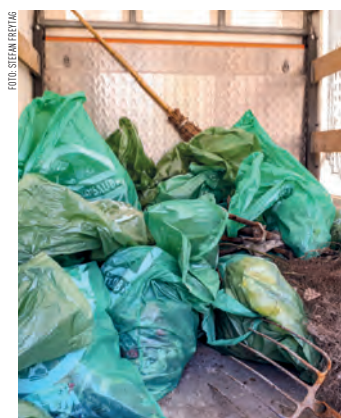
Die „Ausbeute“ nach der Gewässerreinigung durch die Freiwilligen.

UMWELT. Von der Hantel fürs Gewichtheben über einen Teppich zu alten Fahrradteilen – bei der Gewässerreinigungsaktion entlang von Inn, Gießen und Weißenbach wurde auch heuer wieder viel Müll entdeckt und eingesammelt. Rund sechzig jüngere und ältere HelferInnen, darunter auch eine Jugendmannschaft vom SV Hall beteiligten sich an der Reinigungsaktion. Nicht schlecht staunten die Kinder, als ein Fußball an diesem Vormittag auf dem Inn angetrieben kam. Vom Umweltamt wurden die HelferInnen als Dankeschön bestens gepflegt.