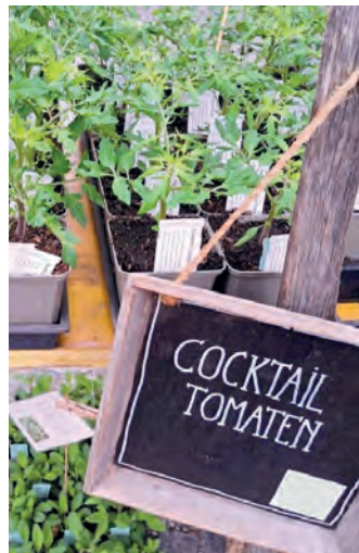
Angeboten wird beim Markt alles, was das Gärtnerherz begehrt.

Der Eintritt beträgt im Vorverkauf 15,- Euro, an der Abendkasse 17,- Euro bei freier Platzwahl. Ermäßigungen gibt es für unterstützende Mitglieder mit einem Kartenpreis von 13,- Euro. Unter 15 Jahren ist der Eintritt frei. Kartenvorverkauf online unter: https://shop.eventjet.at/speckbacher2026 oder unter www.speckbacherstadtmusik.at Kartenhotline unter Tel. 0664/400 6070 oder im Büro des Tourismusverbandes Region Hall-Wattens am Unteren Stadtplatz 19.