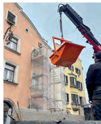
Über Kran und Treppengerüst wird Material an- und abgeliefert.