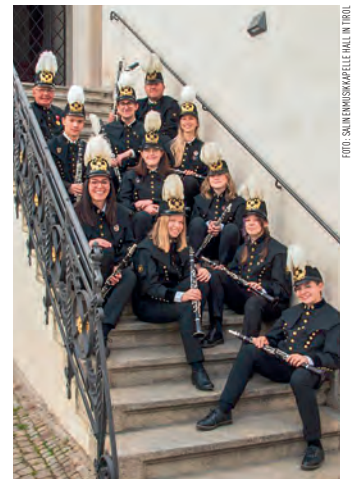
Die Klarinetten der Salinenmusik.

KULTUR. Am Vormittag des Freitags, 1. Mai ziehen die Klarinetten durch den Stadtteil und starten unser Pilotprojekt „Maiblasen“. Dabei möchten die MusikantInnen den Feiertag musikalisch verschönern und bringen frische Klänge direkt in die Nachbarschaft. Sie sind dankbar für ein kurzes Zuhören, ein nettes Hallo und – wer mag – über eine kleine Spende. Jeder Euro fließt direkt in die Jugendarbeit, um den musikalischen Nachwuchs zu fördern. Die Klarinetten der der Salinenmusik Hall freuen sich auf einen klangvollen Vormittag.