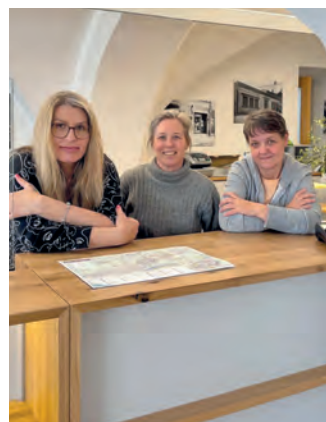
Das Team des Stadtservice im Rathaus.