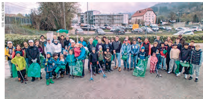
Mit Müllsäcken und Greifzangen wurde Unrat entlang der Gewässer gesammelt.