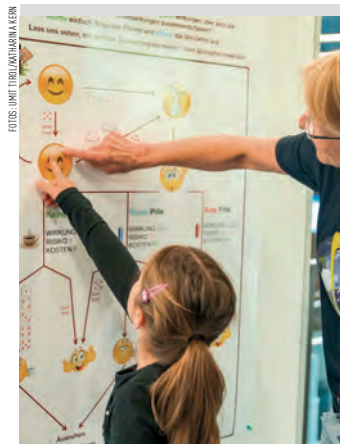
Bei der Langen Nacht gibt es Forschung zum Zuschauen, Mitmachen und Staunen.