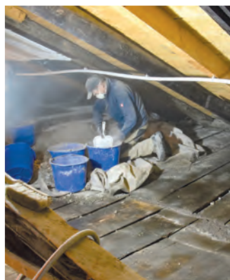
Mit Freilegen vom Schuttmaterial wurden die alten Deckenbretter sichtbar.

gende Termine werden auf die Zeit nach der Baustelle verschoben. Bürotrauungen finden aktuell keine statt. Wir bitten um Verständnis.“ Infrastrukturell kommt es mit der Sanierung zu einer kleinen Änderung: „Das Büro des ehemaligen Standesamtsleiters wird nach der Sanierung mit zwei statt einem Arbeitsplatz ausgestattet, da wir mit zwei Teilzeit- und zwei Vollzeitmitarbeitern neu einteilen. Ab ca. Mitte Mai kann der Betrieb im Standesamt im Rosenhaus wieder wie gewohnt laufen, gerade rechtzeitig zum Start der Hochzeitssaison.“