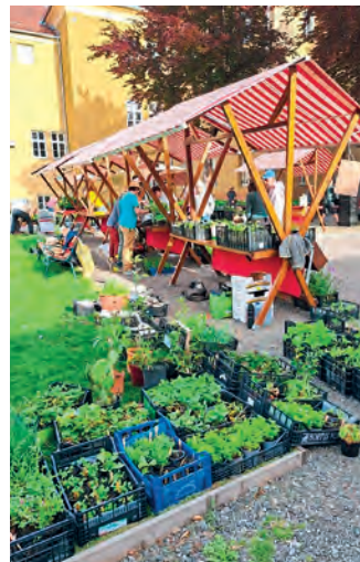
Der Platz am Marktanger wird zum Treffpunkt für Gartenfreunde.