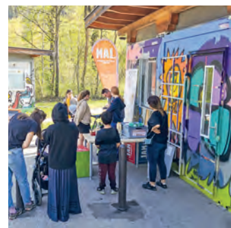
Der JAM-Container als Treffpunkt am Sportplatz Pigar.

JUGEND. Eingeladen sind nicht nur Jugendliche zwischen 11 und 19 Jahren, sondern auch jüngere und Erwachsene, um das Angebot kennenzulernen. Aus aktuellem Anlass, plant das Team von JAM auch ein Graffiti Projekt. Auf den Wänden des Fußballkäfigs vor dem Container waren rechtsextreme und islamfeindliche Schmierereien angebracht worden (z.B. Schwarze Sonne, Fuck Islam). Nach einem Zeitungsbericht, hat die Stadtgemeinde Hall die Schmierereien provisorisch übermalen lassen. Am Tag des offenen Containers soll genau dort ein Graffiti Projekt stattfinden, unter dem Motto „Gemeinsam sind wir Hall“. Idee ist es, dass sich nicht nur Jugendliche daran beteiligen können, sondern auch Kinder und Erwachsene. Da-