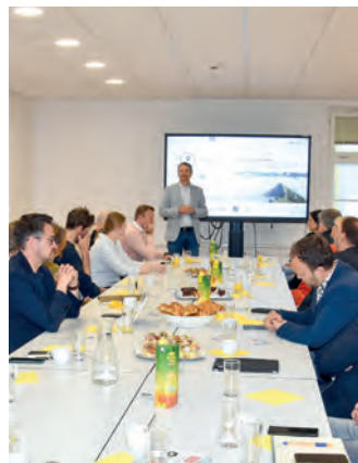
Vortrag und Austausch zum Thema Leerstand in der Haller Altstadt.

Mit der Initiative „Leerstand.beleben“ wird in Tirol ein sichtbares Zeichen für starke Ortskerne gesetzt. In sieben teilnehmenden Regionen werden im Aktionsmonat April in den Gemeinden Reutte, Imst, Landeck, Hall in Tirol (siehe Details zu den Terminen im Infokasten), Schwaz, Hopfgarten im Brixental und Lienz leerstehende Räume und Geschäftsflächen temporär genutzt, um mit Schaufensterausstellungen Perspektiven für die Wiederbelebung von Leerstand aufzuzeigen.