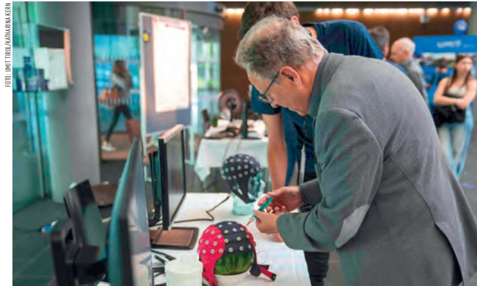
Bei der Langen Nacht gibt es Forschung zum Zuschauen, Mitmachen und Staunen.

Speziell für Kinder wurde eine Wissensrallye entwickelt, bei der