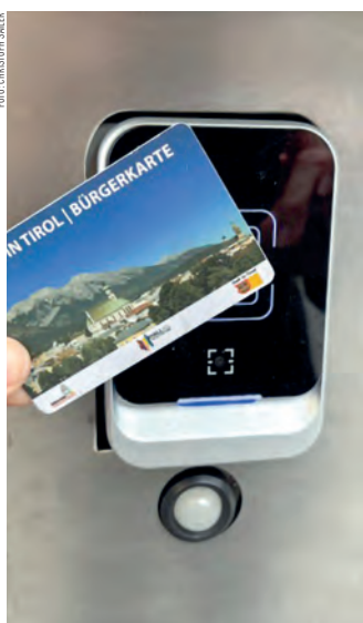
Zutritt nur mit der Bürgerkarte.

3. Teil des Podcasts über den Service der Haller Stadtverwaltung.