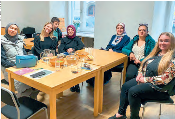
In entspannter Atmosphäre wird im Sprachcafé Deutsch vermittelt.

Form eines Schecks feierlich übergeben. „Wir sind stolz, gemeinsam einen Beitrag leisten zu können – denn nur gemeinsam können wir viel bewirken! Die BesucherInnen dankten es mit guter Laune und einem gemeinsamen Ständchen. Der MGV pflegt auch weiterhin die altbewährte Tradition und freut sich bereits auf einen neuerlichen Besuch in der kommenden Adventzeit“, so der Tenor der Sängerrunde bei der Übergabe.