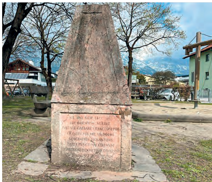
Der Basispunkt der Landvermessung am Kugelanger in Hall in Tirol, errichtet vom militärgeographischen Institut im Jahr 1851.

Emmaus Innsbruck gegründet. Der Verein gehört zur Caritas der Diözese Innsbruck und bietet Meschen mit Suchterfahrung Arbeits- und Wohngemeinschaften und therapeutische Begleitung. Wer wollte nicht schon immer mal hinter die dicken Mauern des Klosterareals blicken? Waren manche vielleicht schon heimlich dort? Jetzt haben wir die Möglichkeit, die SoLaWi vom Betreuer des Projektes BENEDIKT erklärt zu bekommen. Treffpunkt ist am Montag 20. April um 17 Uhr, dort wo die Thurnfeldgasse in die Kaiser-Max-Strasse mündet!