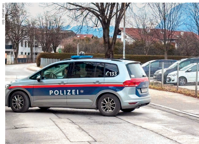
Der Westen von Hall war teilweise komplett von der Polizei gesperrt worden.

Schließlich konnte die US-amerikanische 125-Kilogramm-Fliegerbombe durch den alarmierten und aus Linz angereisten