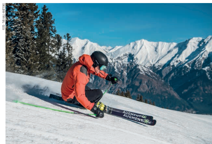
Am Glungezer herrschen perfekte Bedingungen für alle Wintersportler.

Offen für alle nicht in Hall wohnhaften Personen. Das Nenngeld in der Gästeklasse beträgt 12,- Euro (wird bei der Startnummernausgabe