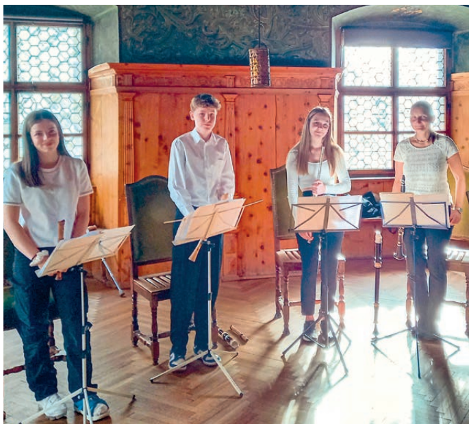
Im vergangenen Jahr trat die Gruppe „Holzbläser kreativ“ im Rathaus auf.