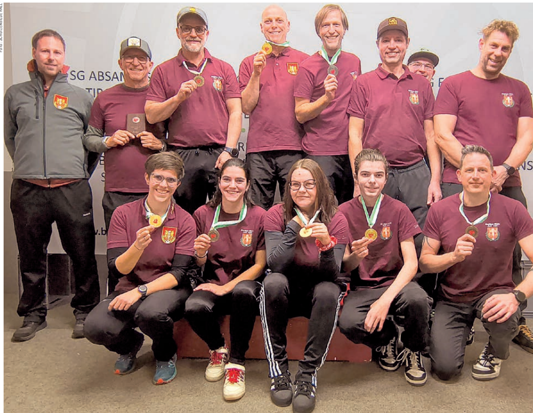
Die treffsichere Mannschaft der Schützengilde Hall überzeugte gleich in mehreren Klassen mit der Luftpistole.

Bei der Bezirksmeisterschaft Luftpistole im Leistungszentrum Arzl konnten die HallerInnen brillieren.