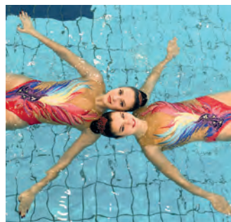
Ein starker Auftritt in der Slowakei.