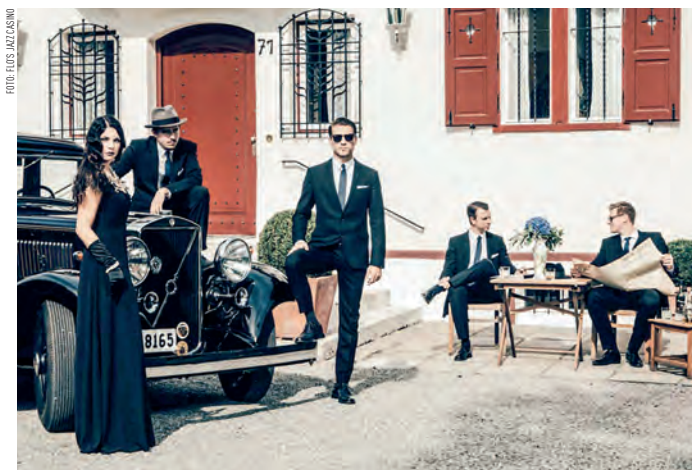
Flo's Jazz Casino interpretieren Highlights aus dem Italian American Songbook.

Flo's Jazz Casino ist eine Hommage an den amerikanischen Jazz zu Beginn des 20. Jahrhunderts bis hin zur Swing Ära. Flo Baumgartners Band nimmt Sie mit auf eine Zeitreise in die Clubs und Casinos der 20er, 30er, 40er und 50er Jahre. Zurück in eine Zeit als eine euphorisierte junge Generation in den Speakeasies und Jazz Clubs der Prohibition trotzte und der elektrisierende Swing Beat die von Rauch- und Leidenschaft