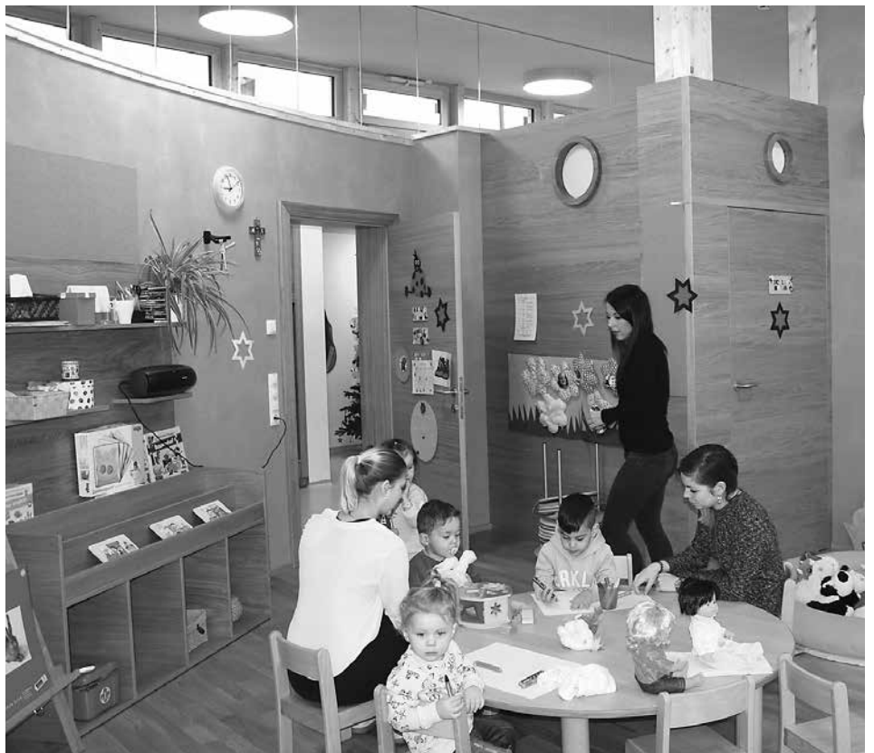
In der Kinderkrippe Bachlechnerstraße.

Es liegt in der Natur der Sache, dass das Thema Kinderbetreuung und außerschulische Betreuung für jede Gemeinde immer ein „work in progress“, also eine laufende Arbeit ist. Hall nimmt seine Verantwortung wahr, um mit bestmöglicher Information das erforderliche Rüstzeug zu haben, rechtzeitig die richtigen Entscheidungen zu treffen. Dafür setze ich mich ein und dafür erbitte ich nun auch die Mitarbeit der Eltern, für die ich mich jetzt schon herzlich bedanke. Ich möchte auch die Gelegenheit nützen, um mich bei allen in diesem Themenbereich Kinderbetreuung / Nachmittagsbetreuung Tätigen für ihre verantwortungsvolle und engagierte Arbeit zu bedanken.