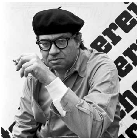
Morton Feldman.