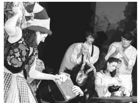
Auch turbulente Szenen bietet das Märchen, ist doch die Hexe in den Teufel verliebt.

Die Premiere geht am 17. November über die Kolpingbühne, die weiteren Termine: 18., 24., 25. November, 1., 2., 8., 9., 15., 16., 21. 22. Dezember; Beginn ist jeweils um 15 Uhr Karten im Vorverkauf online unter www.kolpingbuehne.at , bei NINA Rödlich / Schlossergasse 3, Hall oder im TVB Region Hall-Wattens / Unterer Stadtplatz 19.