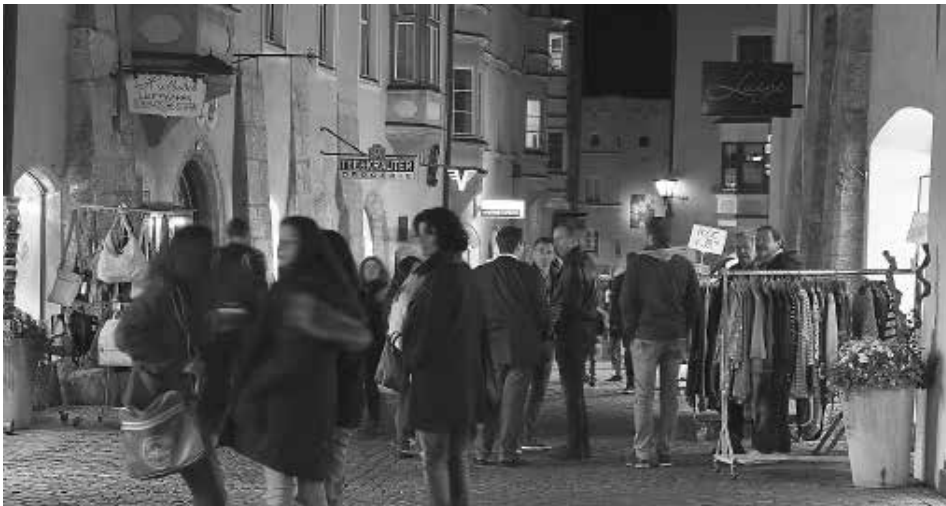
Gerne kann man das umfangreiche Angebot beim Haller Nightseeing lange genießen, denn am nächsten Tag ist Nationalfeiertag.

Am Vorabend des Nationalfeiertages öffnet man in der Altstadt von Hall wieder Tür und Tor, um den BesucherInnen einen Blick auf so manches Verstecktes und Unbekanntes zu ermöglichen. Es ist ein ganz besonderes Erlebnis, beim Nightseeing am Donnerstag, 25. Oktober, bis Mitternacht bei den vielen Haller Kaufleuten einzukaufen, durch die Gassen von Kulturpunkt zu Kulturpunkt zu flanieren, Sonderausstellungen und neue Themenführungen kennenzulernen und dabei Live-Musik zu genießen.