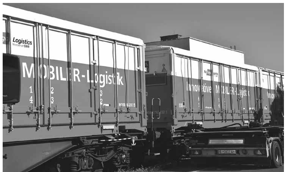
Eine hydraulische Hubvorrichtung am MOBILER-Fahrzeug ermöglicht den raschen und unkomplizierten Umschlag der MOBILER-Behälter zwischen Lkw und Waggon – ohne Kran bzw. eigener Anschlussbahn.

Bereits im Jahr 2011 ging das Recycling Zentrum Ahrental in Betrieb. Gemeinsam mit der IKB werden dort die Haushaltsabfälle der Bezirke Innsbruck-Land, Schwaz und der Stadt Innsbruck sortiert und einer Wiederverwertung zugeführt. Umweltfreundlich geht es dank dem MOBILER, einem innovativen Produkt der Rail Cargo Group, nach Linz zur thermischen Verwertung. Damit werden jährlich mehr als 3.740 LKW-Fahrten und über 1 Mio. Tonnen CO 2 eingespart.