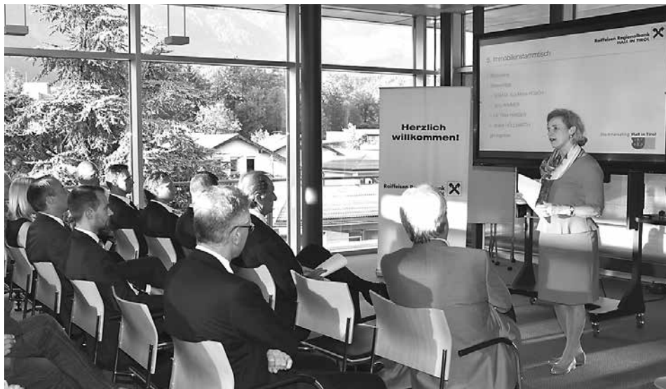
Im Panoramasaal der Raiffeisen Regionalbank Hall traf man sich zum 5. Immobilien-Stammtisch.

Die Stadtentwicklung Halls, Raumordnung aus Gemeindesicht, Entwicklungen am Immobilienmarkt und das Projekt Glungezer Neu waren spannende Themen des 5. Immobilien-Stammtisches, zu dem die Raiffeisen Regionalbank Hall und das Haller Stadtmarketing kürzlich geladen hatten.