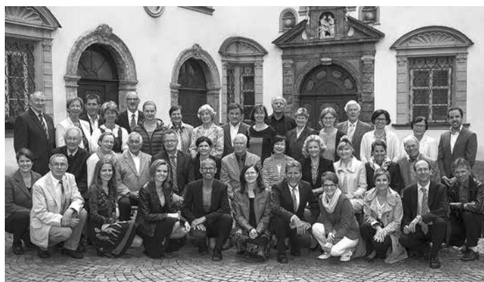
Chor und Orchester der Pfarre St. Nikolaus Hall laden zum Kirchenchor.