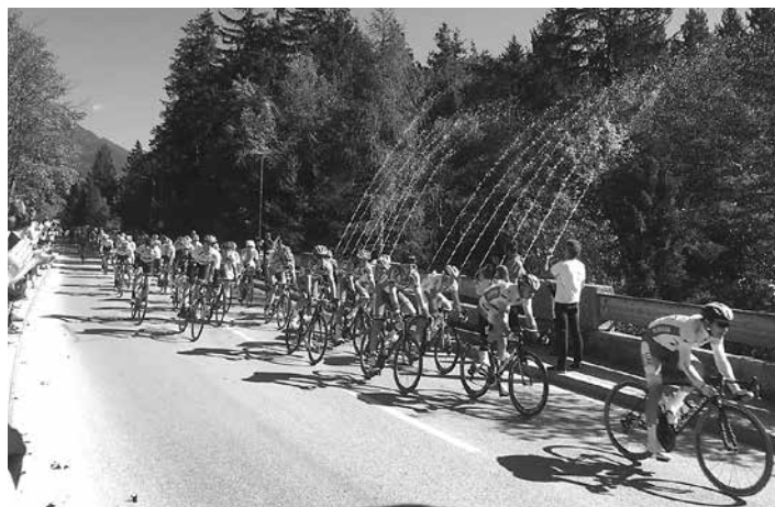
Die Wasserfontäne an der Walderbrücke.

Zudem wurde im Vorfeld der WM ein kurzer Trailer produziert, in dem sowohl die Wasserspiele als auch die auf 2018 Stück streng limitierten Rad-WM Silbermünze der Münze Hall zu sehen waren. Dieses rund 30-Sekunden lange Video wurde zudem täglich in allen Live-Fanzone der WM eingeblendet.