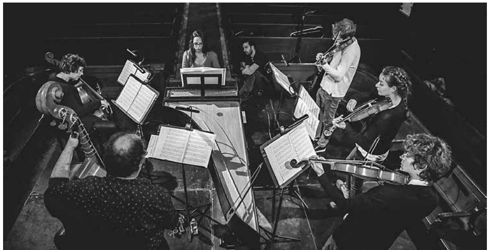
Das Ensembles Il Convito steht am Beginn der neuen musik+-Saison.

Einem der wichtigsten Komponisten der zweiten Hälfte des 18. Jahrhunderts, dessen revolutionäres Genie Haydn, Mozart und Beethoven stark beeinflussen wird – Carl Philipp Emanuel Bach – zollt Il Convito größte Aufmerksamkeit.