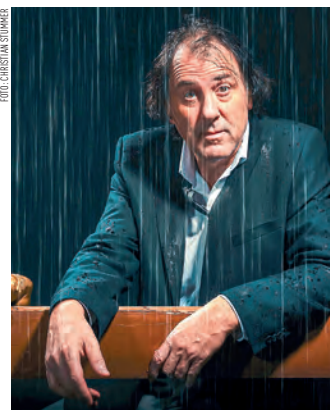
Stefan Waghubinger fragt sich: „Hab' ich Euch das schon erzählt?“

Mehr Programm und Information unter: www.stromboli.at