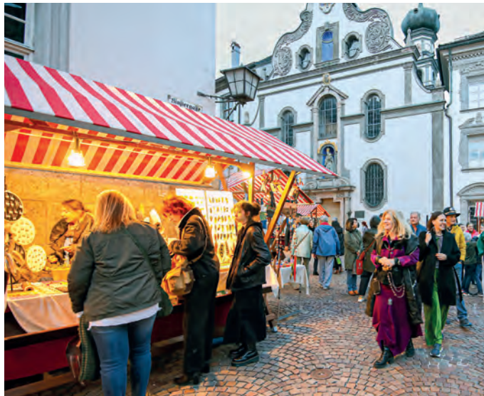
Am Stiftsplatz findet ein großer Nachtmarkt mit buntem Angebot statt.

Mehr Information unter: www.nightseeing.at