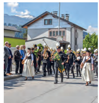
Die Salinenmusik Hall sorgte für den festlichen musikalischen Rahmen.