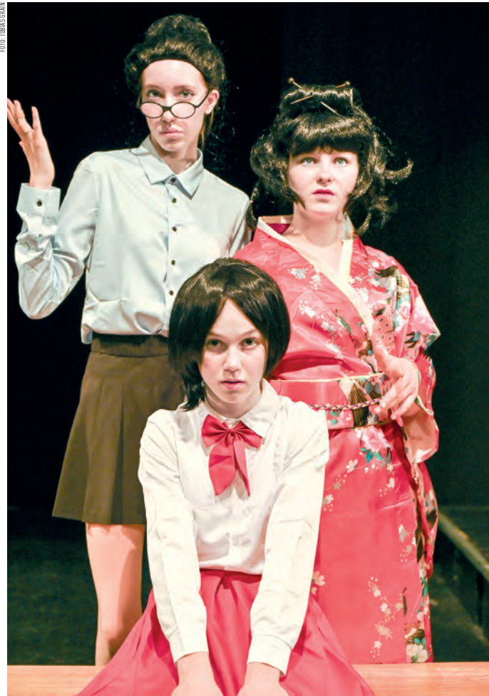
Theaterstück in Form eines japanischen Manga-Comics – freigegeben ab 12.

Miyus Alltag ist stressig. Ihre Eltern setzen sie unter Druck, auch in der Schule zählt nur ihre Leistung. Anstatt ihr beizustehen, drangsaliert ihr Bruder Feytanabe sie schonungslos. Und außerdem ist sie auch noch unglücklich in Leikyū, den Schwarm aller Schülerinnen, verliebt. Miyu träumt davon, alledem entkommen zu können. Doch dafür bräuchte sie schon „Superherokräfte“! Als sie mit ihrer besten Freundin Shao heimlich das neueste Computerspiel ausprobiert, schafft Miyu in Windeseile die ersten Levels. Der Meister des Spiels, der „Allerwerteste“, belohnt sie dafür: Sie bekommt die Attribute der „Kriegerin des Windes“ und die Aufgabe, alles Böse in der Welt zu besiegen. Zum ersten Mal glaubt