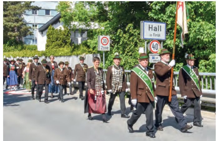
Die Schützengilde Hall mit den Fahnenträgern, Schützenkönigin und Schützenkönig voran, beim Marsch zum Schießstand über die Ortsgrenze nach Mils.