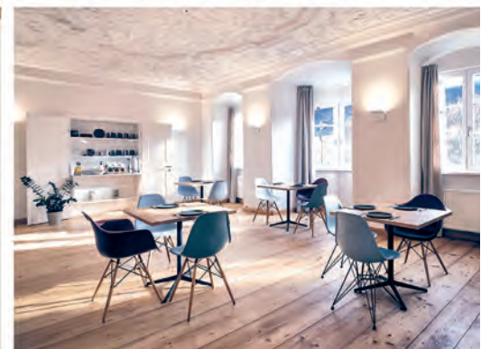
„Die Lendwirtschaft“, Guarinoni Haus, Klocker Museum und das kontor Boutiquehotel (v.l.) können u.a. besichtigt werden.