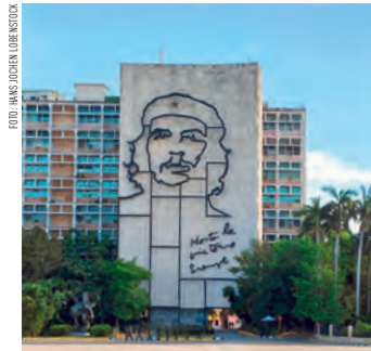
Kubas Nationalheld Ernesto „Che“ Guevara ist allgegenwärtig.

Kuba, die Zuckerrohrinsel, produziert Zucker für den Weltmarkt, aber zur Erzeugung des wichtigen flüssigen Ausführprodukts dem Rum bleibt noch genug. Besonders im Norden wächst auf den fruchtbaren Böden Tabak aus dem der Exportartikel Havanna-Zigarren gedreht werden. Die Revolution unter Fidel Castro prägt bis