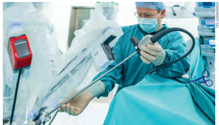
Fachliche Erfahrung trifft am LKH Hall auf modernste Technik.