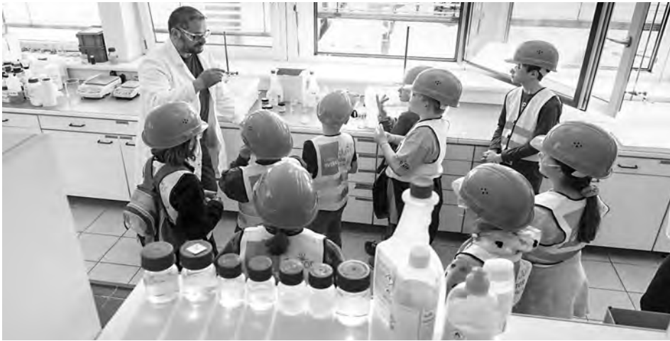
Ausgestattet mit Helm, Schutzbrille und Weste durften die jungen Besucher vom Offenen Werkstor Junior die Produktion der Firma hollu kennenlernen.