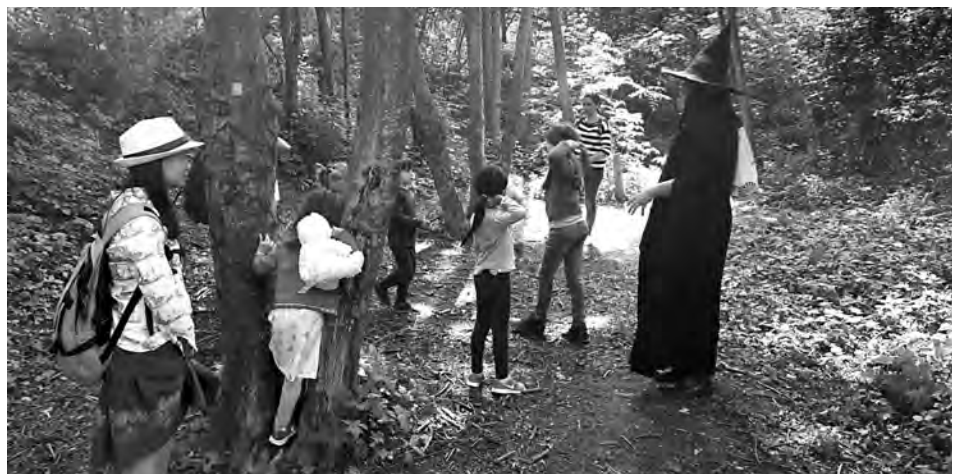
Märchen sind Edelsteine für die innere Schatzkammer.