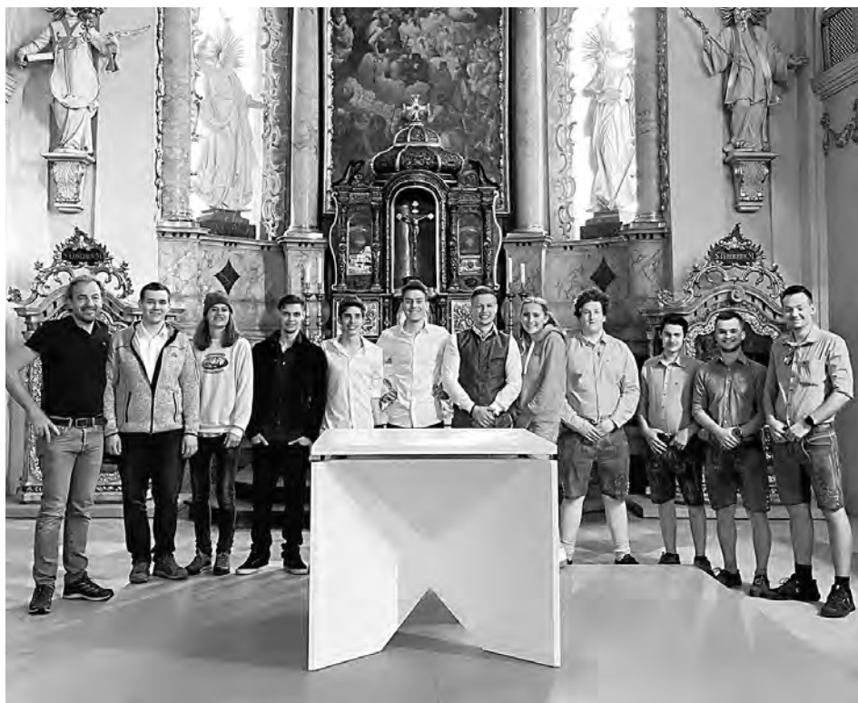
Ein besonderer Moment für SchülerInnen und Lehrer war es, den mobilen Altar, Ambo und Sedilie übergeben zu können und in der Jesuitenkirche aufgestellt zu sehen.