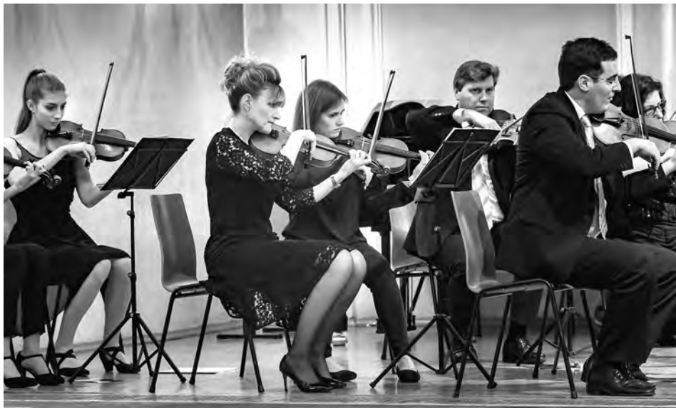
Die Musikschule der Stadt Hall in Tirol gibt im Mai und Juni zahlreiche Konzerte.