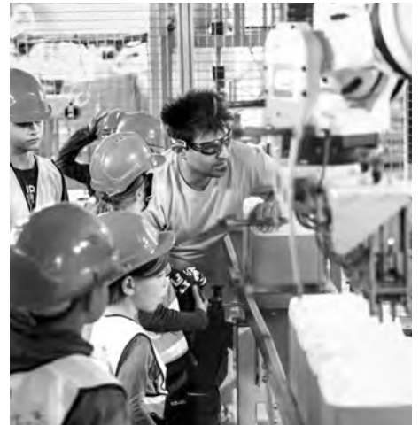
Interessiert ließ sich das junge Forscherteam von den Mitarbeitern alles genau erklären.