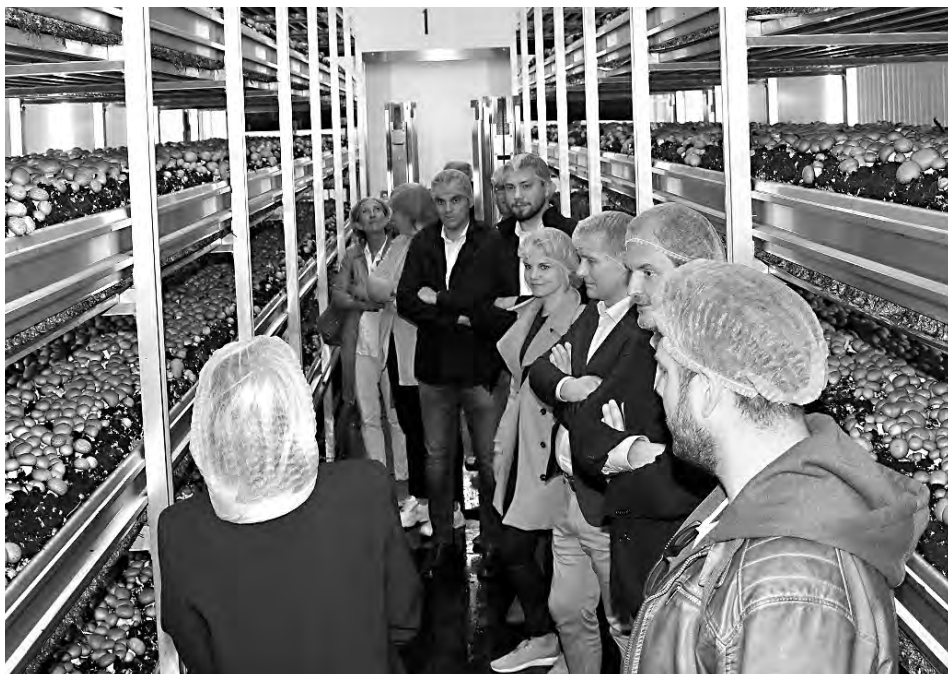
Offenes Werkstor Preview bei Myzelia | Tiroler Bio Pilze in Mils.