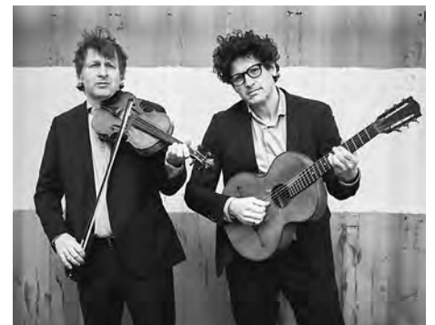
Die Strottern geben am 22. Juni ihr Gastspiel beim BurgSommer.