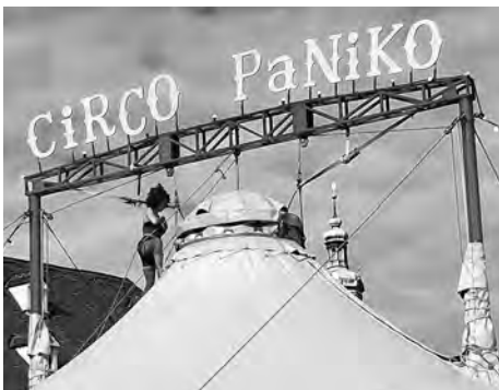
Der Circo Paniko gastiert vom 3. bis 12. Juni im Hofratsgarten der Burg Hasegg.

Den Startschuss zum BurgSommer am 3. Juni gibt wieder CIRCO PANIKO – ein zeitgenössischer Zirkus aus Italien, der bis 12. Juni seine Zelte im Hofratsgarten aufschlägt. Mit im Gepäck haben die KünstlerInnen, die Groß und Klein mit einem packenden Mix aus Artistik, Akrobatik, Live-Musik und Tanz begeistern,