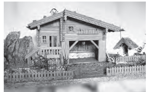
Mit einem Los um nur 5,- Euro nehmen Sie an der Verlosung dieser Krippe teil und unterstützen das Kinderhospiz-Team.

Der Verein Haller Laufftreff verlost in der Vorweihnachtszeit zwei Tiroler Krippen. Diese werden bis zum 8. Dezember, in der Auslage Wallpachgasse 2 ausgestellt. An diesem Tag wird die Gewinnnummer gezogen und über die Homepage des Vereins Laufftreff sowie auf Facebook und in der Stadtzeitung bekanntgegeben. Ein Los ist um 5,- Euro über den Verein Laufftreff bzw. beim Augenoptiker Madersbacher in der Wallpachgasse erhältlich. Die Einnahmen werden ebenso wie die Einnahmen vom Sterntalerlauf an das Kinderhospiz-Team in Hall gespendet.