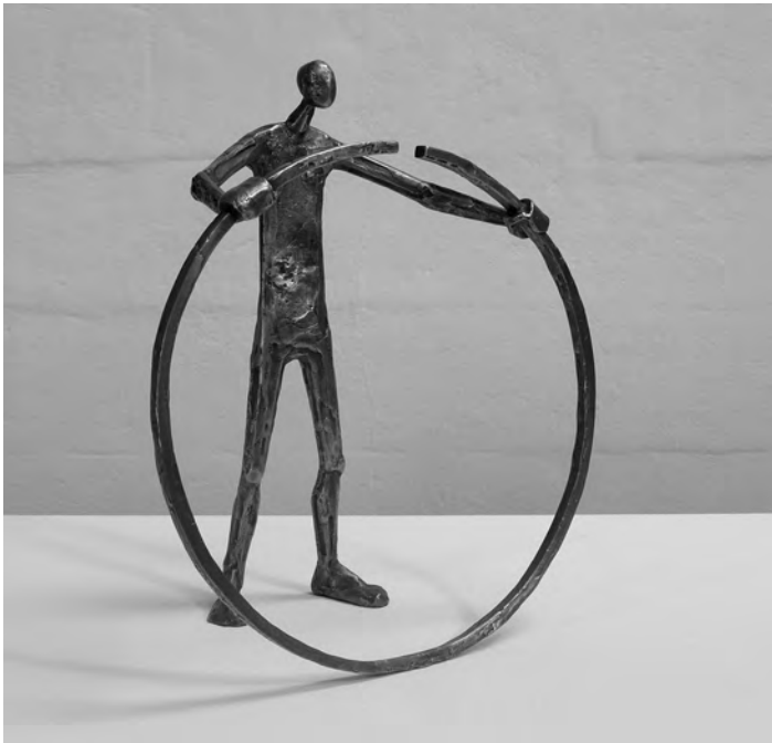
Witz und Ironie kommen bei Erwin Burgstaller selten zu kurz: Im Bild eine Skulptur in Bronze mit dem Titel „Fast“.