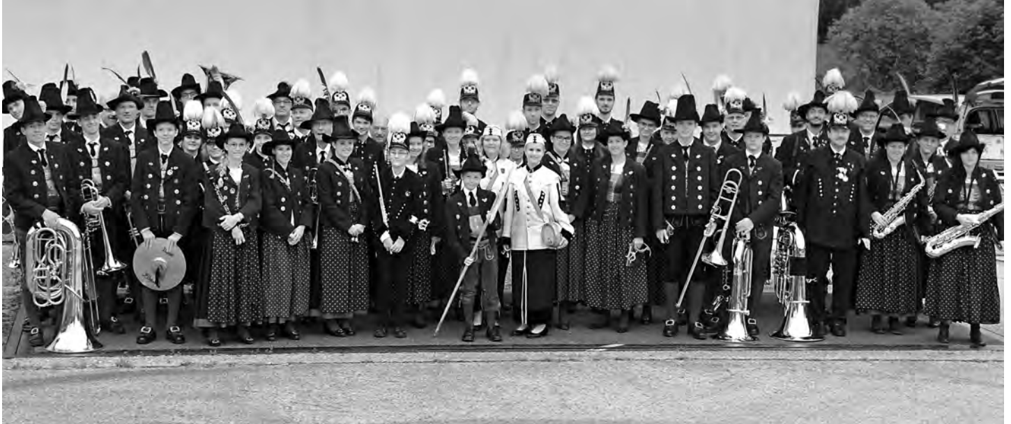
Das Blasmusikfest Hall in Tirol verbindet nicht nur Musikkapellen aus der Region sondern auch Generationen von Musikern.

Salinenmusikkapelle, Speckbacher Stadtmusik und zahlreiche Jugendmusikkapellen treten am Samstag gemeinsam im Altstadtpark auf. Dieses generationenübergreifende Fest der Musik ist längst zur lieb gewordenen Tradition geworden und aus dem Haller Veranstaltungskalender nicht mehr wegzudenken.