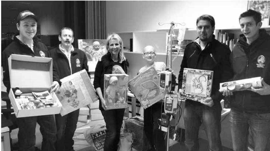
Mit viel Kinderspielzeug stellten sich die Speckis auf der Kinderkrebstation Innsbruck ein.

diversen Arbeitseinsätzen, Bastelarbeiten für die Tombola beim Ball, Knödeldrehen für unsere Bergmesse im Voldertal oder Unterstützung der Jungschützen. Die Pflingstrosensträuße der Marketenderinnen zu Fronleichnam sponsert sie ebenfalls jedes Jahr.