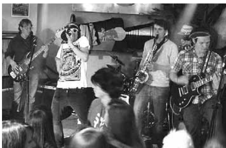
"The Lubbers" - am 7. Jänner im park in

Am Freitag, 7. Jänner, ab 20 Uhr, sind im Jugendhaus park in bei freiem Eintritt zwei junge Südtiroler Bands live zu erleben. "Average" ist eine Punkrockband, die 2005 gegründet wurde. Anfangs spielte die Band hauptsächlich Covers von Punklegenden wie Pennywise oder Ignite. Mittlerweile konzentrieren sich die fünf Jungs mehr auf eigene Songs und sind gerade dabei ihre erste CD auf den Markt zu bringen. Kompromisslose Riffs gepaart mit einer einzigartigen Stimme zeichnet die Band aus. "The Lubbers" sind fünf „Vollblutmusiker“, die sich anfangs noch durch die Indieszene coverte spätern, jedoch dann auch eigene Songs aus den Ärmel schüttelten.