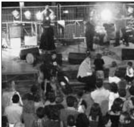
Klein hat es angefangen, das italienische Fest - nun ist es ein Publikumsmagnet