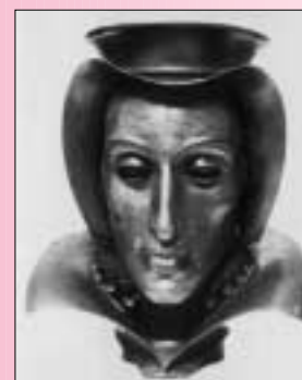
Erzherzogin Magdalena, ein Werk des Metallbildhauers Rudolf Reinhart

ab 5 Personen nach Anmeldung beim TVB, Tel. 0 52 23 / 56 2 69