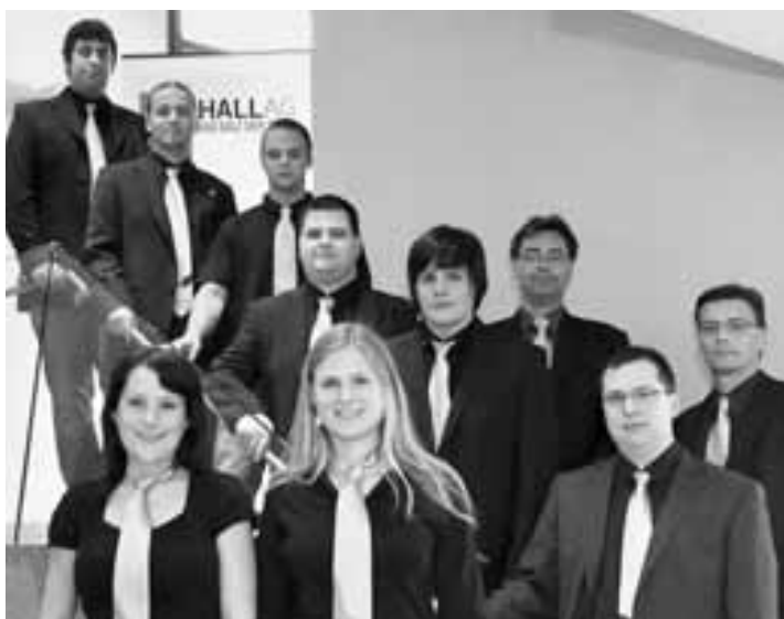
Das Team des citynet@hall ist jederzeit bereit für Kontaktaufnahme.