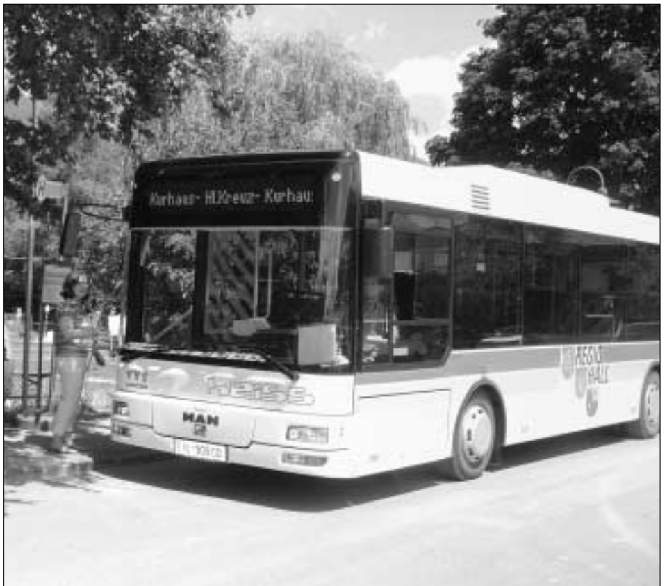
Der Regiobus – ein weiteres attraktives Angebot im öffentlichen Nahverkehr.

Die Haltestellen der Linien nach Gnadewald bzw. Mils entnehmen Sie bitte der Regiobus-Broschüre, die Sie auch noch im Stadtservice erhalten.