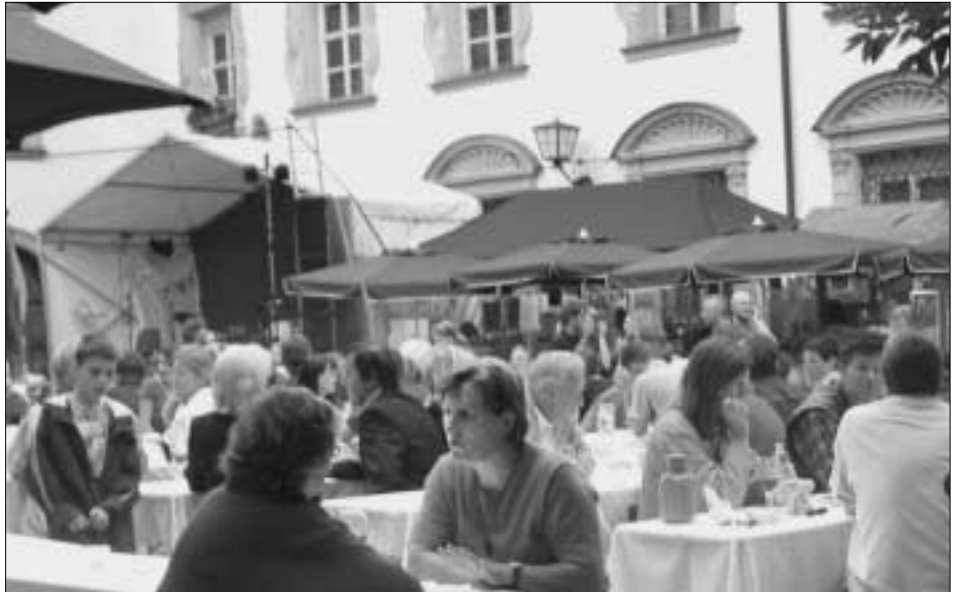
Am 9. August wird der Stiftsplatz wieder italienisch.

Die Festa Italiana findet bei jedem Wetter statt! Für den Regenfall stehen Zelte bereit.