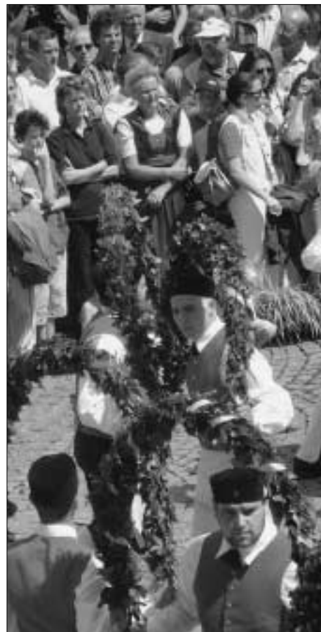
Exaktes Zusammenspiel war notwendig, um die komplizierten Tanzfiguren auszuführen.