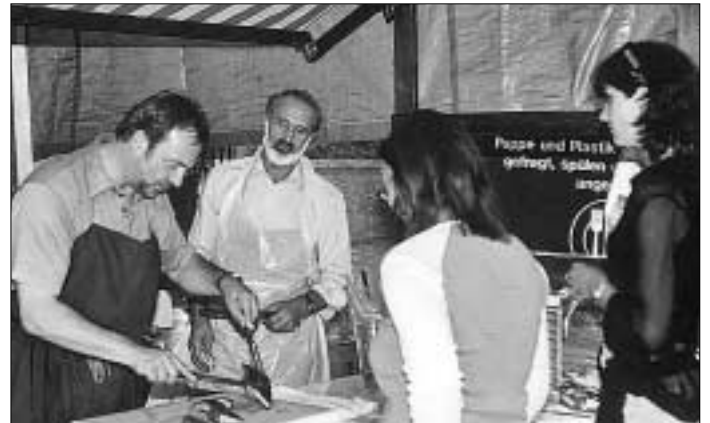
... und Schützen sorgten für kulinarische Genüsse