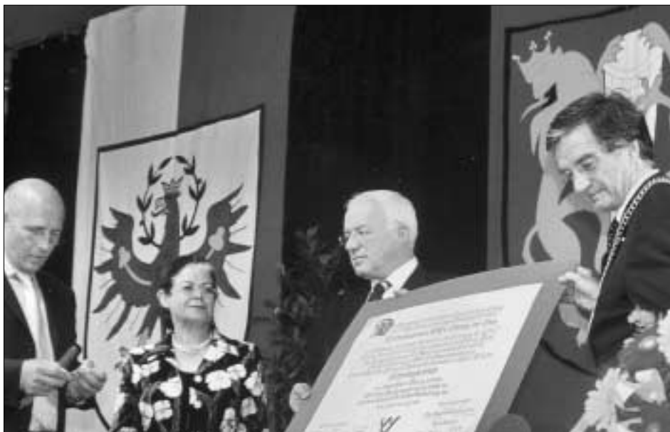
Von seiner Gattin begleitet wurde LH DDR. van Staa, als ihm beim Festakt des Stadtjubiläums die Haller Ehrenbürgerschaft verliehen wurde.