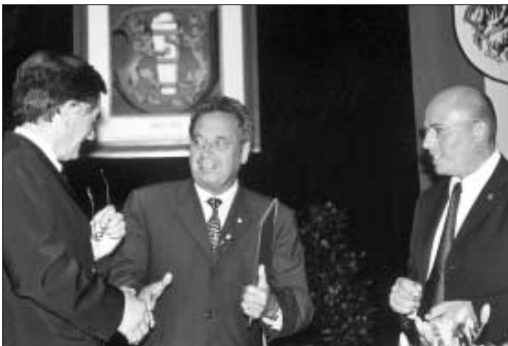
Den Ehrenring der Stadt Hall erhielt Alt-Landesahauptmann Dr. Wendelin Weingartner im Rahmen der Festsitzung des Haller Gemeinderates.