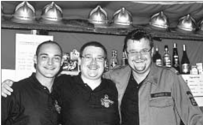
Gemeinsam geht alles leichter: Feuerwehr...