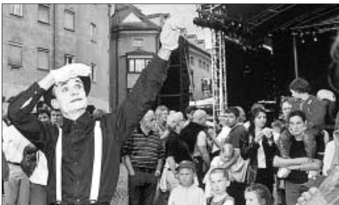
Pantomimenkünstler brachten Poesie ins Stadtfest.