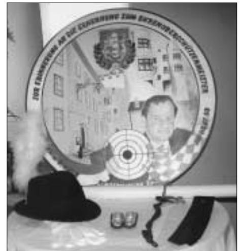
Ehrenscheibe und Schützenutensilien