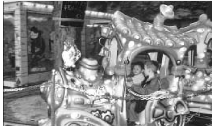
Das Stadtfest zeigte sich auch als Kindertraumland.