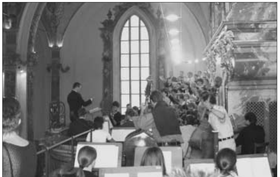
Chor und Orchester gestalteten die Jubiläumsmesse besonders eindrucksvoll.