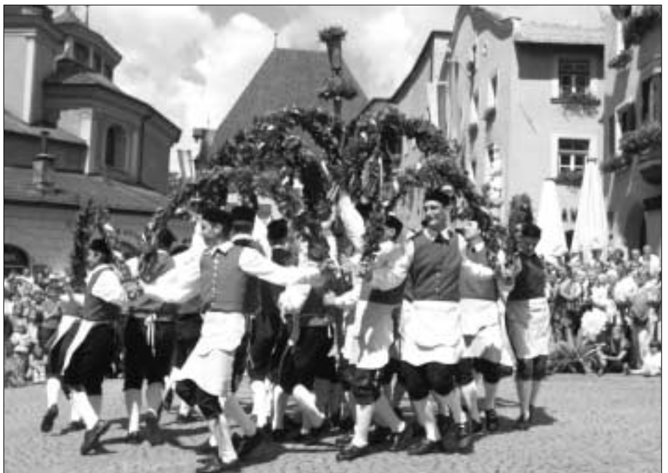
Kunstvolle Figuren waren einstudiert worden für den jahrhundertealten Bindertanz.