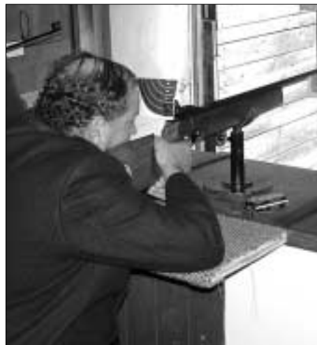
Der neue Ehrenschiützenmeister legte an