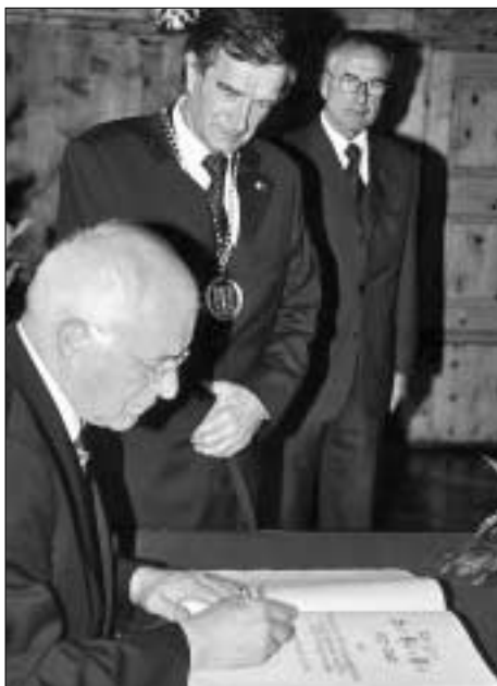
LH van Staa trug sich ins Gästebuch der Stadtgemeinde ein.