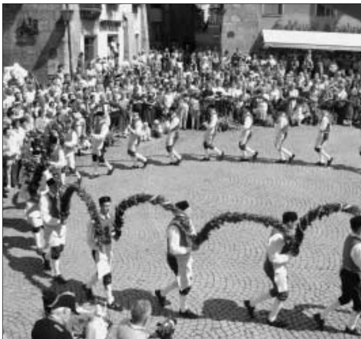
Originales Brauchtum kann sich auch heute noch sehen lassen, wie die hunderten begeisterten Zuschauer bewiesen.