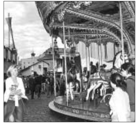
Das Karrusell war beliebter Anziehungspunkt für Kinder – und Fotomotiv für die Eltern.

In den frühen Morgenstunden des Sonntags waren dann viele Kräfte am Werk, um Stände abzubauen und aufzuräumen, die Straßen und Gassen zu säubern, damit die Stadt auch für die Besucher der Aufführung des Bindertanzes ein festliches Bild bot.