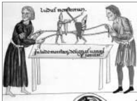
Die faszinierende Welt des Mittelalters kann man am Wochenende in Hall erleben.

Im musikalischen Bereich geben hochrangige Musiker aus Linz, Wien und Prag eine Ahnung davon, wie sich im 14. Jahrhundert Vergnügen und die Sorge um das Seelenheil abspielten: u.a. durch mittelalterliche Stundengebete, kostbare Faksimiles von Stundenbüchern des 14. bis 16. Jahrhunderts, eine Vesper mit anschließender Springtanz-Prozession, ein feierliches la-