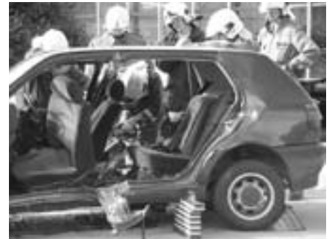
Die Feuerwehr ist immer häufiger bei technischen Einsätzen gefordert.

die Feuerwehren aus Absam und Rum eingeladen. Gerade im technischen Bereich sind solche Gemeinschaftsschulungen sehr sinnvoll, damit auch im Einsatzfall die Ortsfeuerwehr mit den umliegenden Feuerwehren annähernd ähnlich arbeitet, z.B. wenn mehrere Feuerwehren mit Hydraulischen Rettungsgeräten an einem Einsatz beteiligt sind.