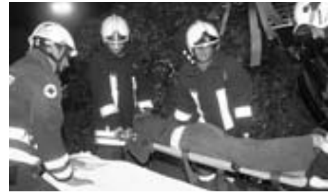
Rettung und Feuerwehr bei einer gemeinsamen Übung

Am vergangenen Samstag hat die Stadtfeuerwehr dann neuerlich eine Gemeinschaftsübung abgehalten. Die Anzahl der technischen Hilfeleistungen steigt stetig an. Neue Fahrzeugtechniken und Material stellen jede Feuerwehr vor neue Herausforderungen. Jeder Verkehrsunfall verlangt individuelle einsatztaktische Maßnahmen. Unter Mithilfe des ÖAMTC (Überschlagssimulator) sowie dem TRT (Technical Rescue Team) der FF Zirl wurden verschiedene Einsatzszenarien durchgespielt. Dazu wurden auch